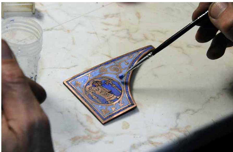
Obr. 1: Záběry z workshopu emailérských technik v Technickém muzeu v Brně v roce 2019.

dvakrát na stejné výzkumné téma, ale naopak, aby byl vědecký výstup opakovaně a efektivně sdílen širokým spektrem uživatelů. V muzejní praxi to znamená např. připravit a sdílet kvalitní metodické návody a příručky, které orientaci v problematice maximálně usnadní. 12