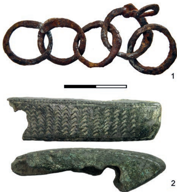
Obr. 40. Břeclav – Pohansko. Severovýchodní předhradí. 1 – kroužky z drátěného brnění (inv. č. P300428), 2 – část hlavice meče (inv. č. P292728).

Obchodní aktivity můžeme s jistou mírou opatrnosti spojit se třemi olovenými závažími bochánkovitého či čtvercového tvaru s otvorem (3 ks; 1 + 2; tab. 214: 1–2). Zcela zvláštní kategorii tvoří železné sekerovité hřivny (54 ks, 11 + 43; tab. 241: 2–7, 242: 1–2), o jejichž účelu se stále vedou spory. Mohly sloužit jako polotovar pro výrobu zelených předmětů (Dostál 1993b, 46) či jako předmincovní (Kučerovská 1980, 211–229; 1989, 19–54), resp. komoditní platidlo (Michal – Procházka 2020). Nejspíše však jejich forma souvisí s kontrolou distribuce železa na Velké Moravě, jejímž prostřednictvím ovládaly elity zbytek společnosti.