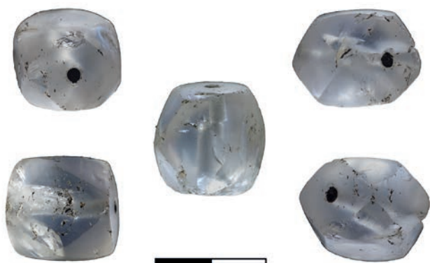
Obr. 38. Břeclav – Pohansko. Severovýchodní předhradí. Korálek z horského křišťálu (inv. č. P294914).

tvořily jen 3 % ze 7 700 nalezených perel (Delvaux 2018, 43). Polyedrickou formu má navíc jen menší část z nich – např. v norském Kaupangu se jedná o šest korálů z 54 známých kusů vyrobených z horského křišťálu. Nálezy z vikingského prostředí ukazují, že se tyto varianty korálů šířily díky dálkovému obchodu Evropou od druhé pol. 9. do první pol. 10. stol., kdy byly jako luxusní artikl oblíbené především u vyšších sociálních vrstev, jak dokládají jejich nálezy např. v bohatých hrobech v Birce či Haithabu (Delvaux 2017, 21–22; Resi 2011, 144–157).