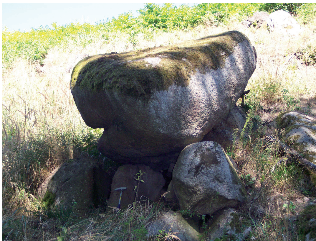
Obr. 4. Skupina žulových balvanů na úpatí VI. těžebního revíru připomíná pravěký dolmen.