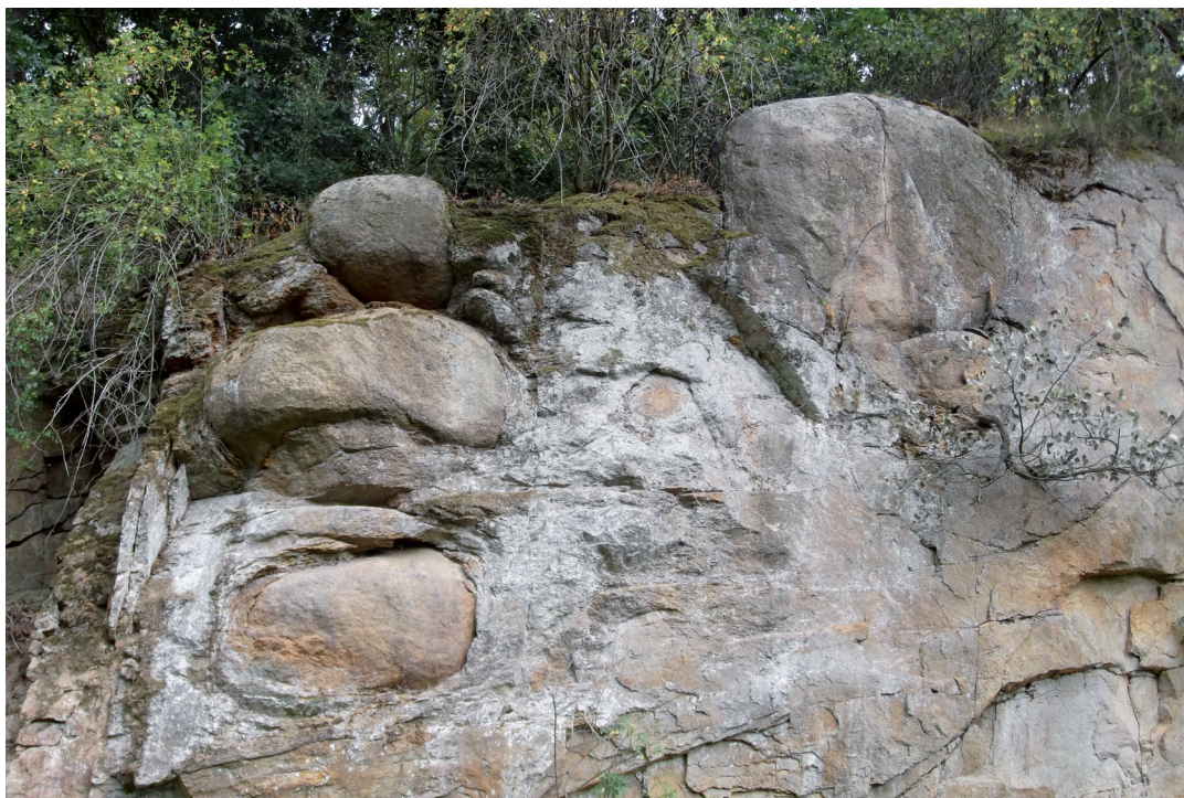
Obr. 2. Vyvřelé granodioritové podloží Krumlovského lesa vytváří kulovité tvary, vyčnívající až na povrch.