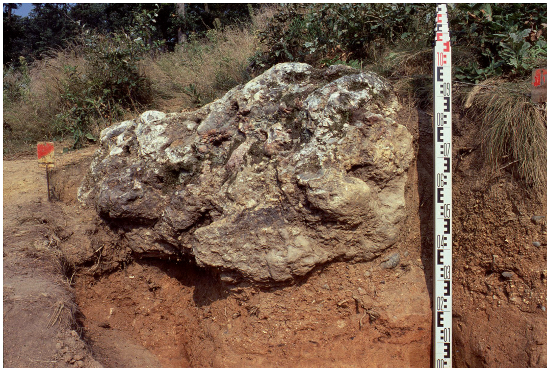
Obr. 9. Blok rohovcové brekcie, přemístěný na vrstvu se štípanou industrií pod vrcholem svahu s těžebním revírem VI.