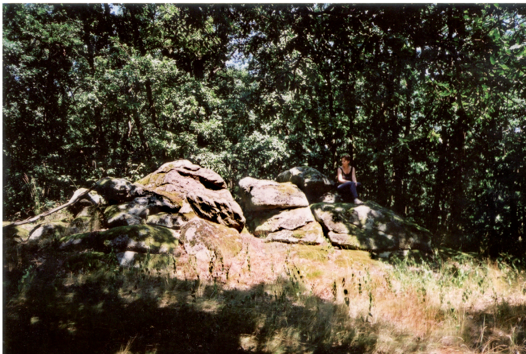
Obr. 10. Skalka na JV okraji plošiny Krumlovského lesa s nálezem depotu kruhovitých hřiven starší doby bronzové.