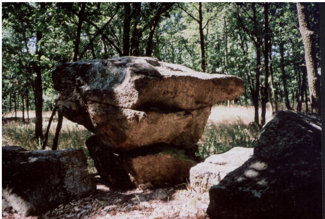
Obr. 3. Skalní hřib v jižní části Krumlovského lesa.