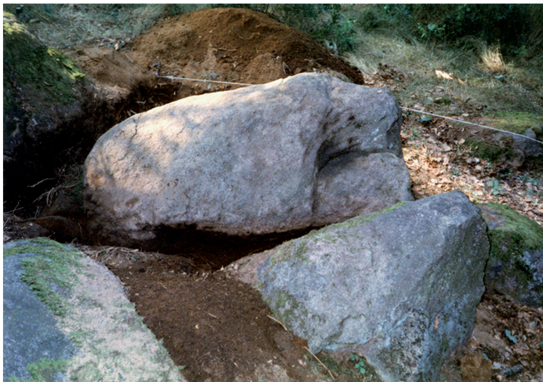
Obr. 7. Podlouhý balvan se dvěma vytesanými hlavami na severním okraji hlavní skupiny žulových balvanů.