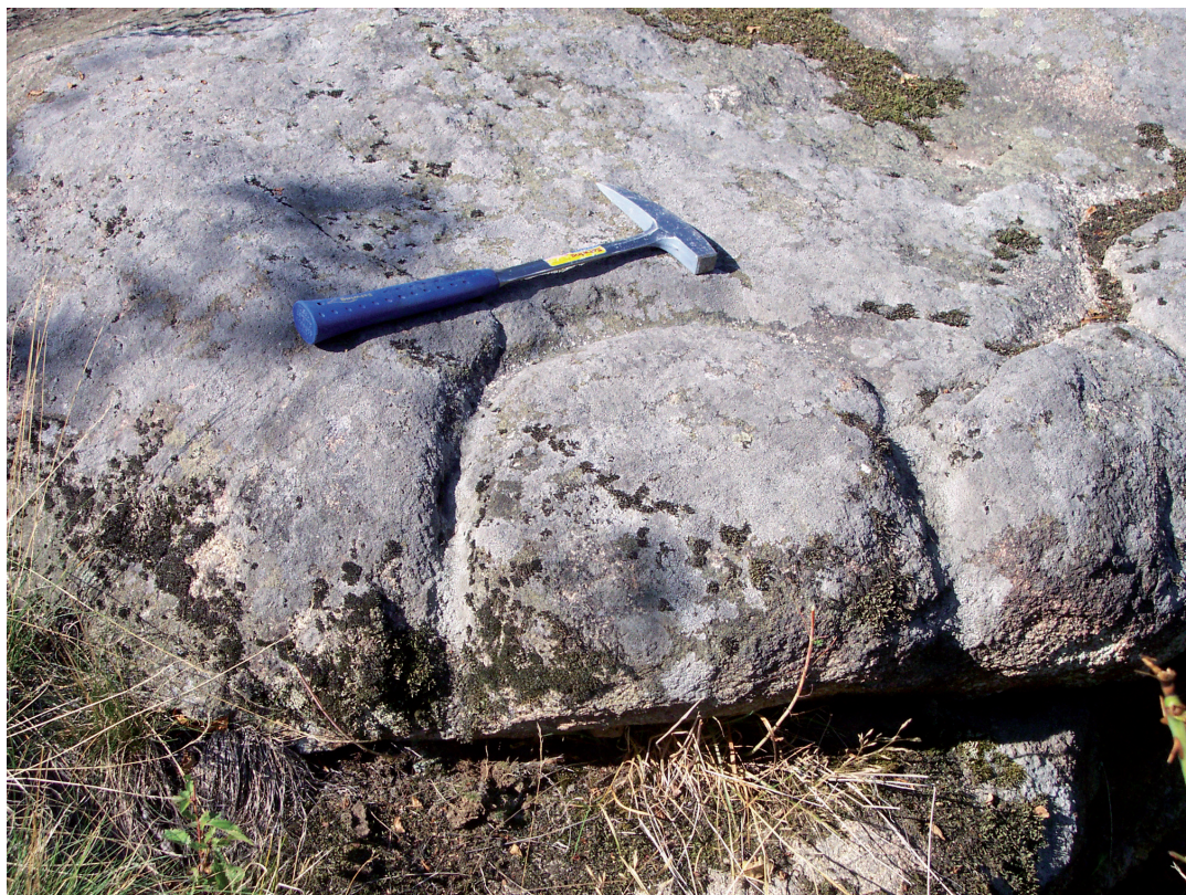
Obr. 5. Plochý výchoz žuly III-5 s vyrytým kruhem byl obklopen štípanou industrií.