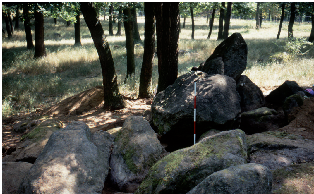
Obr. 6. Skupina žulových balvanů u III. revíru, pohled od JZ. Foto M. Oliva.