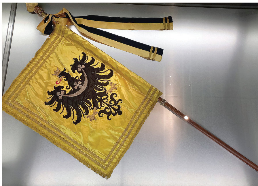
Obr. 2: Banderium Rakouského Slezska (1908), Slezské zemské muzeum (autorská fotografie z expozice).

účinkující průvodu „představovali jak osobnosti a události významné z hlediska kulturní a politické historie panovnického domu, tak jednotlivé národnostní a teritoriální skupiny celé monarchie. Důraz byl přitom kladen zejména na prezentaci folklóru jednotlivých etnik“.