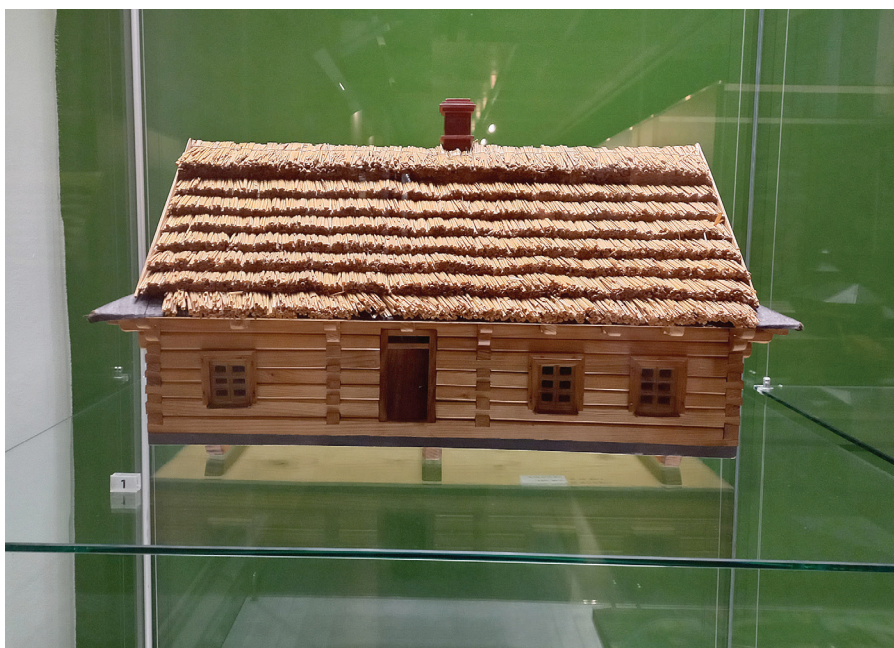
Obr. 1: Roubený dům, Slezské zemské muzeum (autorská fotografie z expozice).

Roubený dům byl od 19. století spjatý s konstrukcí české národní