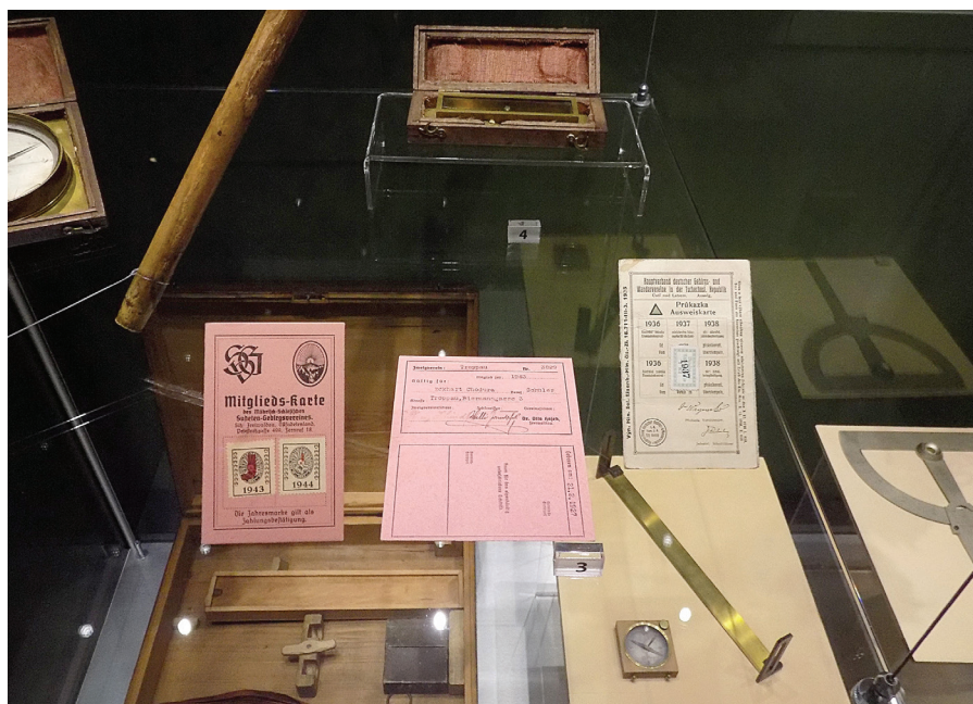
Obr. 5: Artefakty související s dobovým turismem (část turistické hůle, kompas, průkazy členů německého turistického spolku, 19.–20. století), Slezské zemské muzeum.

Turismus je fenomén, který je s českým prostředím tradičně spjatý. Turistika jako aktivní forma trávení volného času v přírodě je u Čechů velmi oblíbená a má mnohaletou tradici. Rozvoj turismu na přelomu 18. a 19. století byl u nás spojen s romantickým hnutím, jehož myšlenky si nejprve osvojovali němečtí měšťané žijící v českém pohraničí. 65 Trend trávit čas v přírodě ale rychle přijali za své i Češi. V první pol. 19. století začaly být na horách budovány první boudy poskytující turistům občerstvení a ubytování. Od druhé poloviny téhož století pak vznikaly první turistické organizace (např. Sokol 1862). Významnou událostí pro český turismus bylo založení Klubu českých turistů v Praze roku 1888. Jeho členové se podíleli na značení turistických tras, na výstavbě rozhleden i turistických chat, na vydávání turistických map