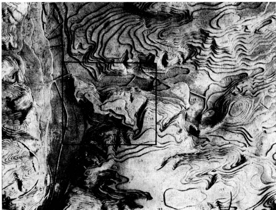
Obr. 1. Vyšehradské území. Výšek z vrstevnicového plánu Prahy a okolí, pořízeného před první světovou válkou pro vojenské účely. Nejvyšší plocha širšího zázemí je vyznačená kótou 235.

vení prvních thesí, které by pak měly být dále zpracovány všemi potřebnými profesemi.