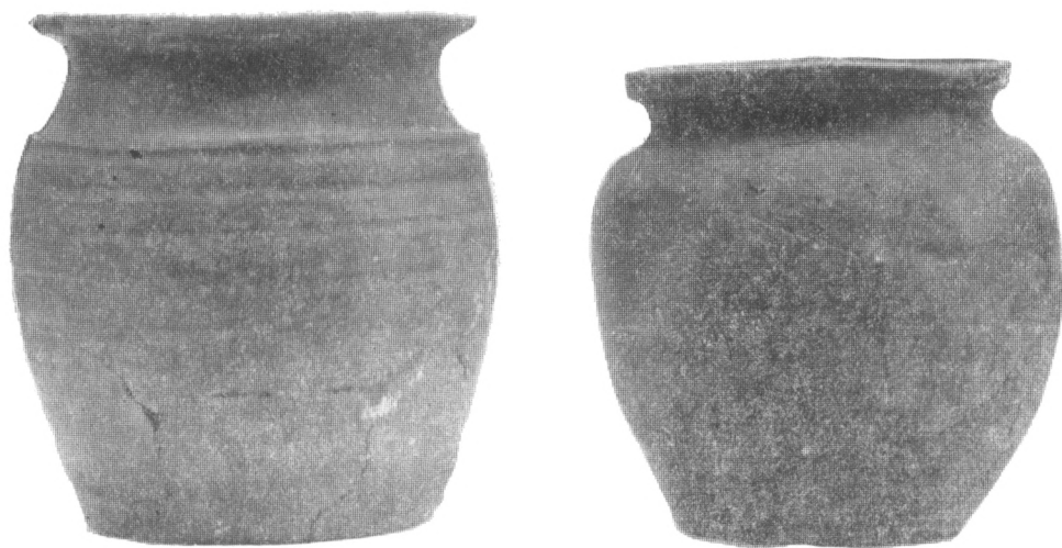
Obr. 2. Hrnce z Týnce n. S.

1971). Západně od rotundy byla zachycena sídlištní plocha s kúlovými objekty, jejíž nejstarší horizont je možno podle získaných nálezů zařadit rovněž do 11. věku. Severně od rotundy byly v místě mladšího kamenného objektu zachyceny stopy velké stavby s kúlovou konstrukcí. Z celkové situace prvotní sídlištní fáze lze soudit, že se po polovině 11. století stal Týnec významným sídlištním i mocenským centrem, jehož založení bylo součástí a spíše dovršením nejstarší fáze vnitřní kolonizace na dolním toku Sázavy, jejíž počátky můžeme položit nepochybně již do 10. věku. Situace týnecké ostrožny nad levým břehem Sázavy a její strategická poloha nad místem brodu dovoluje spolu s určitými