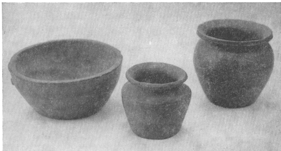
Obr. 1. Keramika z Týnce n. S.