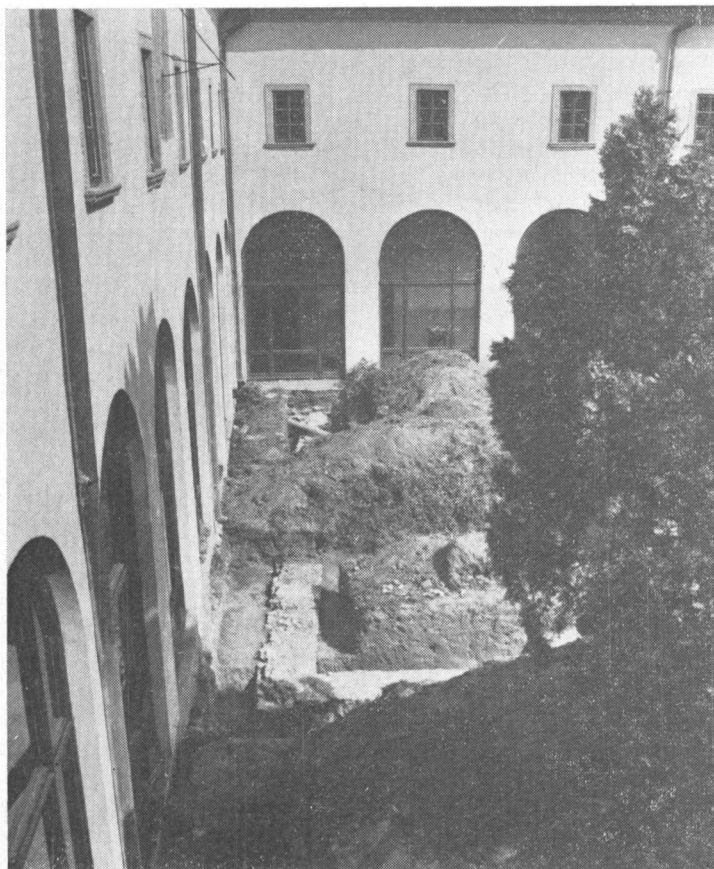
Obr. 1. Základové murivo stavby, odkryté vo vnútornom dvore pôvodného fran-tiškánskeho kláštora.

Pôvodným feudálnym vlastníkom Hlohovca bol panovník, no od r. 1275 patril príslušníkom mocných feudálnych rodov. Z hlohovského hradu spravovali mesto a rozsiahle feudálne panstvo na jeho okolí Ujľakovci, Thurzovci, Forgáčovci, páni z Mitrovíc a Erdödyovci.