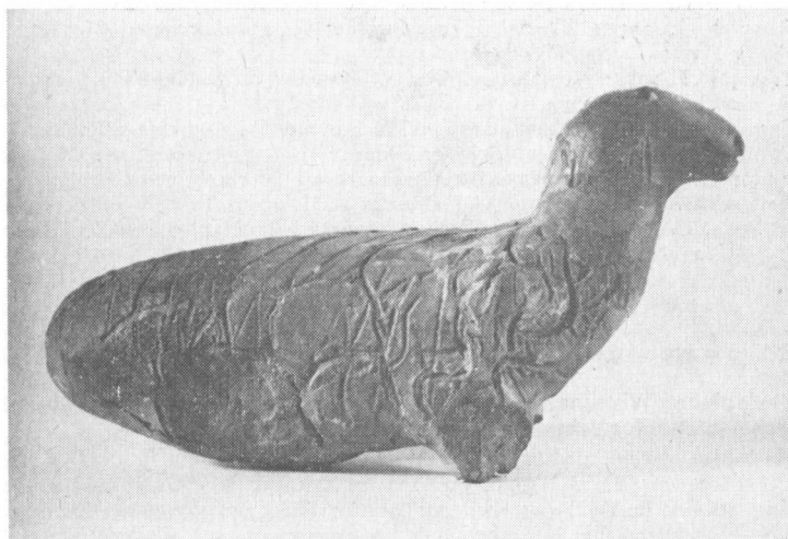
Obr. 5. Stredoveká hlinená plastika. Nález vo dvore kostola Všetichsvätých.

Najpočetnejším nálezovým materiálom, získaným archeologickými výskumami, prieskumami a zbermi bola keramika najčastejšie vo fragmentoch. Z celých a rekonštruovaných predmetov z pálenej hliny sa získali hrnce, krčahy, zásobnice, pokrývky, misky, kahance, praslensy, kachlice a nechýbala ani keramická plastika (obr. 5). Najpočetnejšie sú zastúpené pokrývky, pozornosť si zasluhuje keramika z 12.–13. storočia, časti hrubostenných zásobníc, ukážky gotických pohárov a kach-