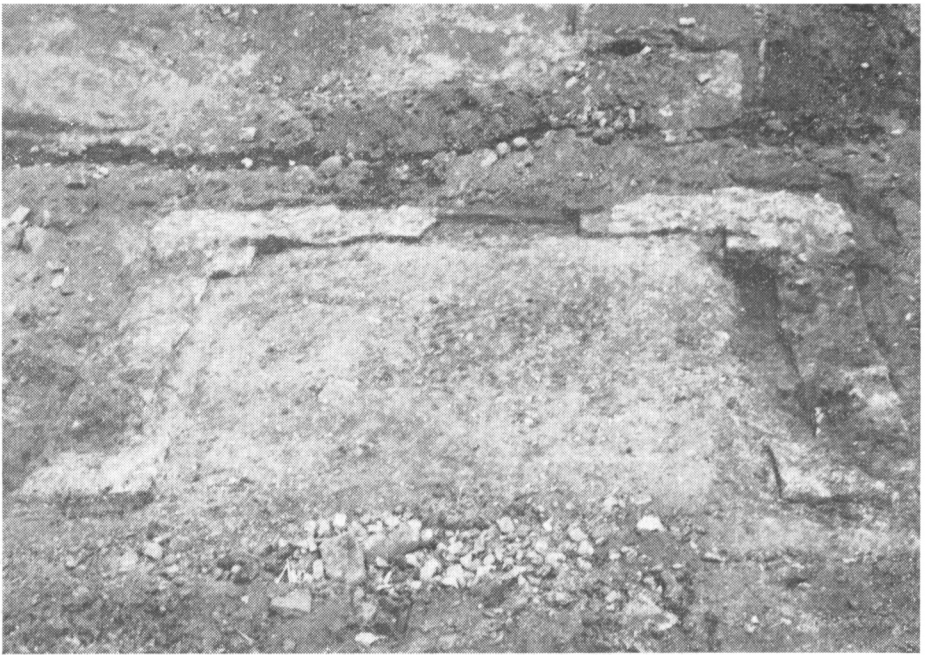
Obr. 2. Zachované murivo kamenného domu z 15.–16. storočia v centrálnej časti Hlohovca.