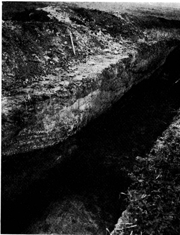
Obr. 1. Zaniklá ves Divice u Brumovic. Na řezu lokalitou „Kostelík“, která je pozůstatkem „motte“, je patrné sprašové podloží i původní černozemní vrstva s kulturními pozůstatky. Výrazně barevně odlišené souvrství je pozůstatkem sypání „motte“.

Na základě dosavadního stavu bádání můžeme vývoj Divic shrnout následovně: V první třetině 13. stol. došlo v neosídleném údolí staré sídelní oblasti k založení vesnice Divic. Iniciátorem, organizátorem a držitelem vsi byla šlechtická rodina, z níž známe Předbora a jeho syny Přibyslava, Svěslava a Divu (CDB III, č. 107, str. 133). Záhy zde byl postaven i kostel, pravděpodobně související nějakým způsobem se sídlem feudální rodiny. O přesné lokalizaci, ani podobě