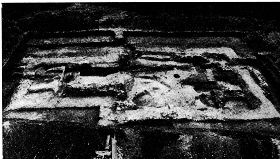
Obr. 3. Zaniklá ves Divice u Brumovic. Pozůstatky kostela odkrytého v letech 1985–1987 od severu po vybrání většiny hrobů uvnitř kostela.

tohoto sídla však dnes ještě nemáme představu. Po zničujícím požáru někdy ve druhé polovině 13. stol. bylo na lokalitě postaveno nové feudální sídlo a to v podobě „motte“. Snad v této době, nebo možná i o něco později, byl původní kostel nahrazen kostelem větším. Náhled do života Divic umožňují i sporé písemné prameny 14. a 15. stol., v nichž se objevují jména divických feudálů, dvůr, kostelní podací, lány, podsedky a vinice (ZDB III, 451, V, 473, VI, 363, X, 37). Zánik vsi spadá do 15. stol., přičemž šedesátá léta jsou asi nejzazší mezí.