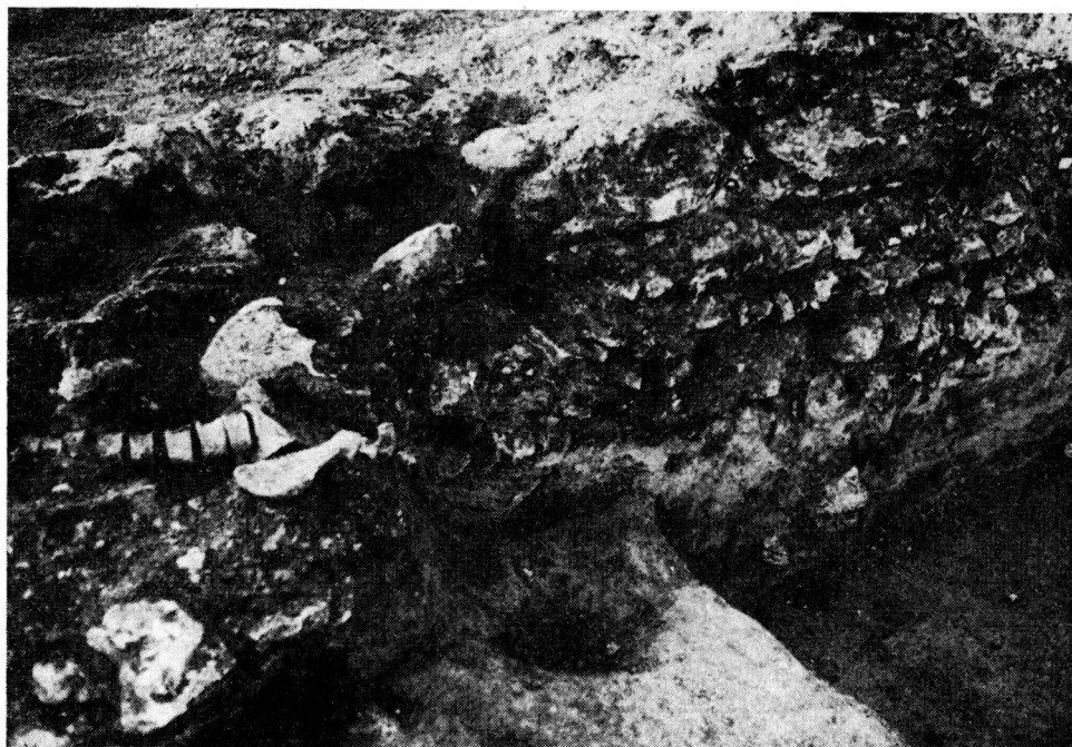
Obr. 5. Zaniklá ves Divice u Brumovic. Zbytky hrobu (obratle a pánev) narušujícího základů starší fáze kostela.