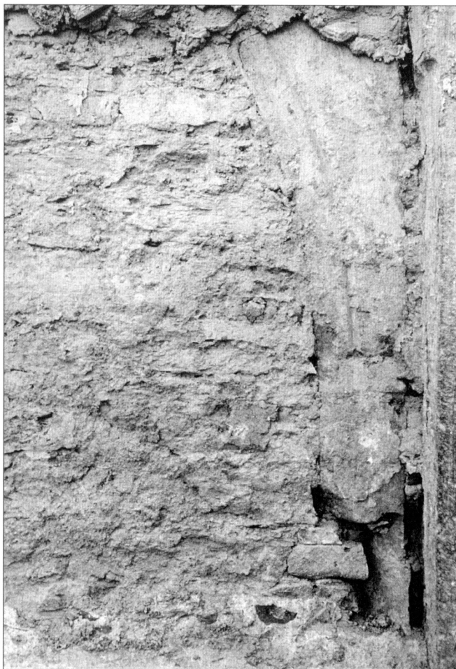
Obr. 5. Vlašim, zámek, detail zbytku hlavice druhého polygonálního sloupu – vedle barokního portálu, 1997.

místě – těsně u rohu terasy napekována. Tyto vrstvy jsou dochovány jen místy a jsou skryté nyní pod novou omítkou, prováděnou v době průzkumu. Arkády byly ve spodní části později, patrně při barokní a znovu při klasicistní přestavbě překryty plentou z cihelných úlomků a soklem, sestaveným původně z velkých, plochých, nepravidelných kamenů, při opravách doplňovaný omítkovou napodobeninou (např. v jihozápadním rohu). Přes arkády probíhaly klasicistní pilastry ze smíšeného nebo cihelného zdiva, přizděné přímo k arkádě nebo její zadržce. V období barokní přestavby byly arkády narušeny okenními a dveřními otvory ve zcela jiném modulu, při čemž byla pravá část oblouku a hlavice sloupu druhé arkády zleva zčásti zničena. Při přestavbě byla odstraněna i vrchní část oblouku třetí arkády, u níž osazením kamenného portálu barokních dveří došlo ke zničení převážné části druhého polygonálního sloupu a poloviny oblouku čtvrté arkády, jejíž sloup je možná skrytý za pilastrem. K dalšímu narušení došlo při osazování novodobých ležatých okének do míst barokních otvorů, avšak nižších, při čemž byly vsazeny nové překlady a velikost otvorů byla mírně upravena.