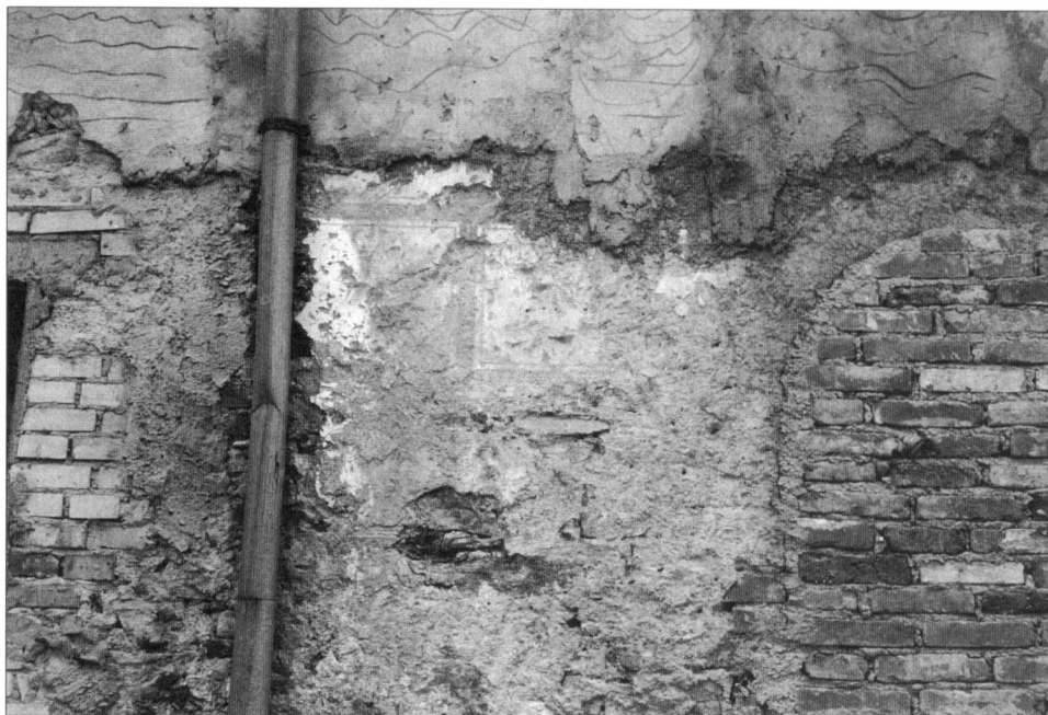
Obr. 6. Vlašim, zámek, severní fasáda konírny, detail zdi s nálezem kvádrového sgrafita vlevo od zazděného třetího půlkruhového okna (od jihovýchodu). 1997.