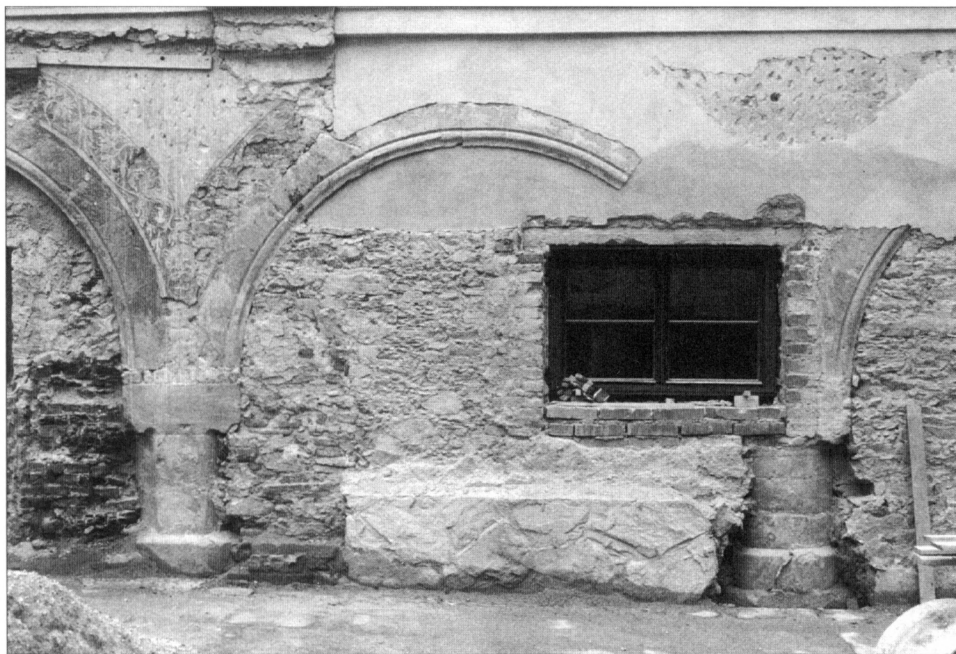
Obr. 3. Vlašim, zámek, nálezy arkád na severní fasádě jižního paláce. Zachovány dva sloupy – vlevo polygonální, vpravo kruhový, 1997.