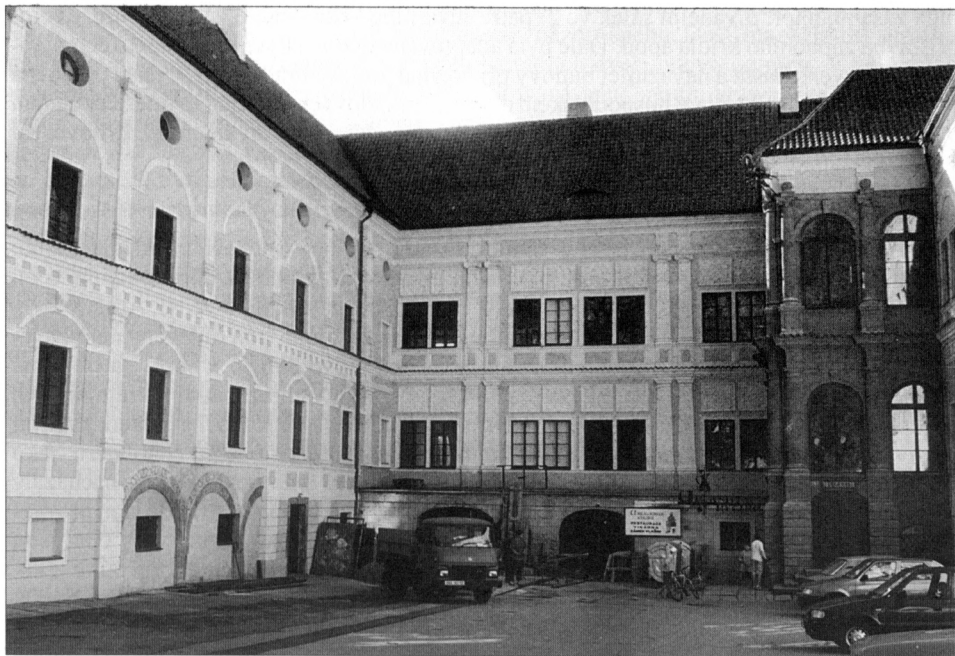
Obr. 2. Vlašim, zámek, čestné nádvoří s nálezem arkád na fasádě jižního (levého) křídla, 1998.