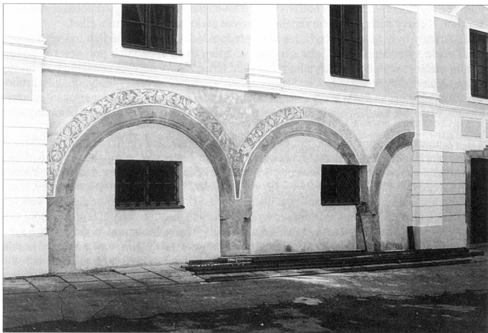
Obr. 7. Vlašim, zámek, čestné nádvoří, analyticky prezentovaný nález části objevených pozdně gotických, renesančně upravených arkád na fasádě jižního křídla, 1998.

filace probíhá rovnoběžně s jeho šikmou stranou i zkrácená a upravená přední strana jeho patky naznačují, že by mohlo jít o úpravu druhotnou. Stejný dojem navozuje i seříznutá profilace hlavice kruhového sloupu, patka je však souměrná. V tom případě by patky i hlavice původně měly patrně souměrný tvar a stejná profilace by probíhala kolem celého dřívku sloupů. Nelze však také úplně vyloučit, že dochovaný tvar měly hlavice od svého vzniku. Ve prospěch této varianty hovoří analogie s mnoha městskými podloubími, kde většinou přední strana sloupu nebo pilíře je rovná. Na hlavice jistě původně dosedaly kamenné oblouky arkády přímo bez vložených cihel, neboť podobná úprava by u takovéto reprezentativní architektury nebyla možná. Takto vypadala pozdně gotická podoba arkád. Nelze s jistotou ani říci, zda původní oblouky z doby pozdní gotiky nebyly mírně hrotité a při jejich zvyšování pomocí cihel, vložených na hlavice pod žebra oblouku nebyl jejich tvar upraven do půlkruhu. Části kamenných žebířů, vložených do vrcholu obou dochovaných arkád, dokonce z jiného materiálu – světlého pískovce u 2. arkády zleva, mohou tuto úpravu naznačovat. Rovněž vzepětí třetího, pouze zčásti dochovaného oblouku se jeví větší, než u dvou dochovaných, téměř úplných arkád.