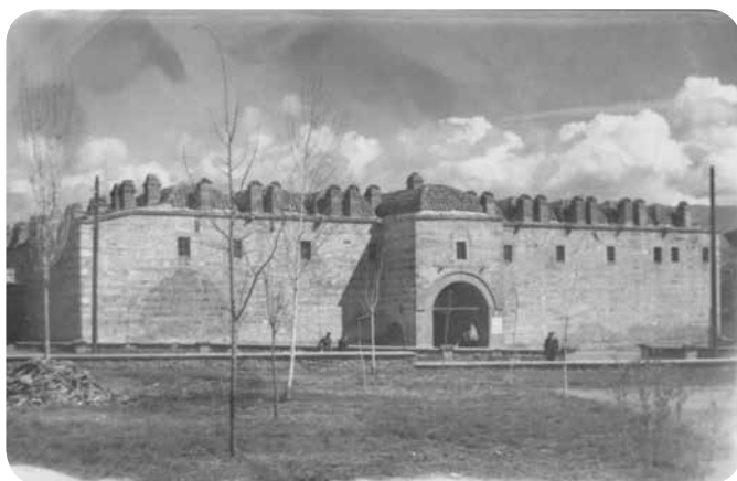
4. Karavansaraj Kuršumli han, průčelí se vstupem, Skopje, 30. léta 20. století [cit. 3. 6. 2022].