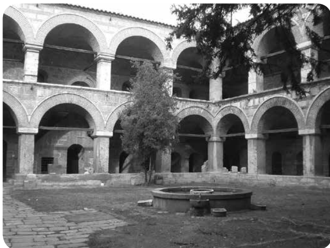
5. Karavansaraj Kuršumli han, vnitřní dvůr s kašnou a arkádovým ochozem v přízemí a patře, Skopje [cit. 3. 6. 2022].