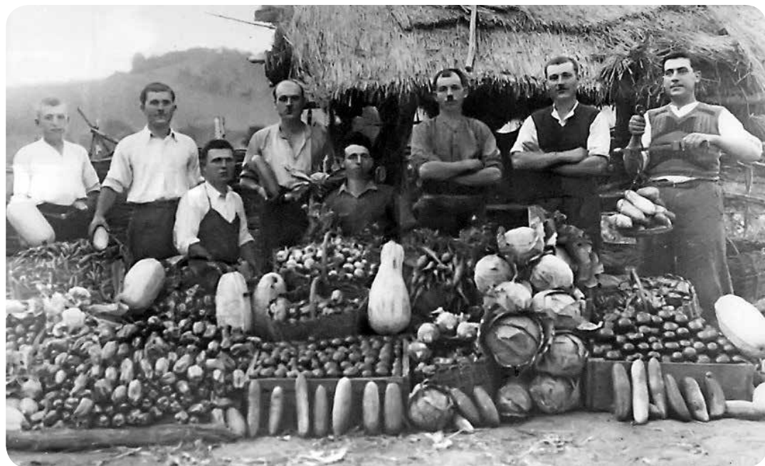
3. Bulharští zahradníci v Maďarsku, 30. léta 20. století [cit. 3. 6. 2022]. Dostupné z: https://bnr.bg/hristobotev/post/101130685Oves?Haberiorur quonsidem et verebenes

V rámci své vědecké činnosti se zabývala etnokulturní problematikou Balkánu ve (středoevropské a mediteránní komparaci. Jejím dalším zájmem byla česká tradiční kultura, urbánní etnologie a dějiny etnologie. Vystudovala etnologii a historii v Brně, specializovala se na ročním studijním pobytu v Bulharsku v 70. letech. Pracovala v brněnské pobožce Etnologického ústavu AV ČR a později na slavistice Filozofické fakulty MU.