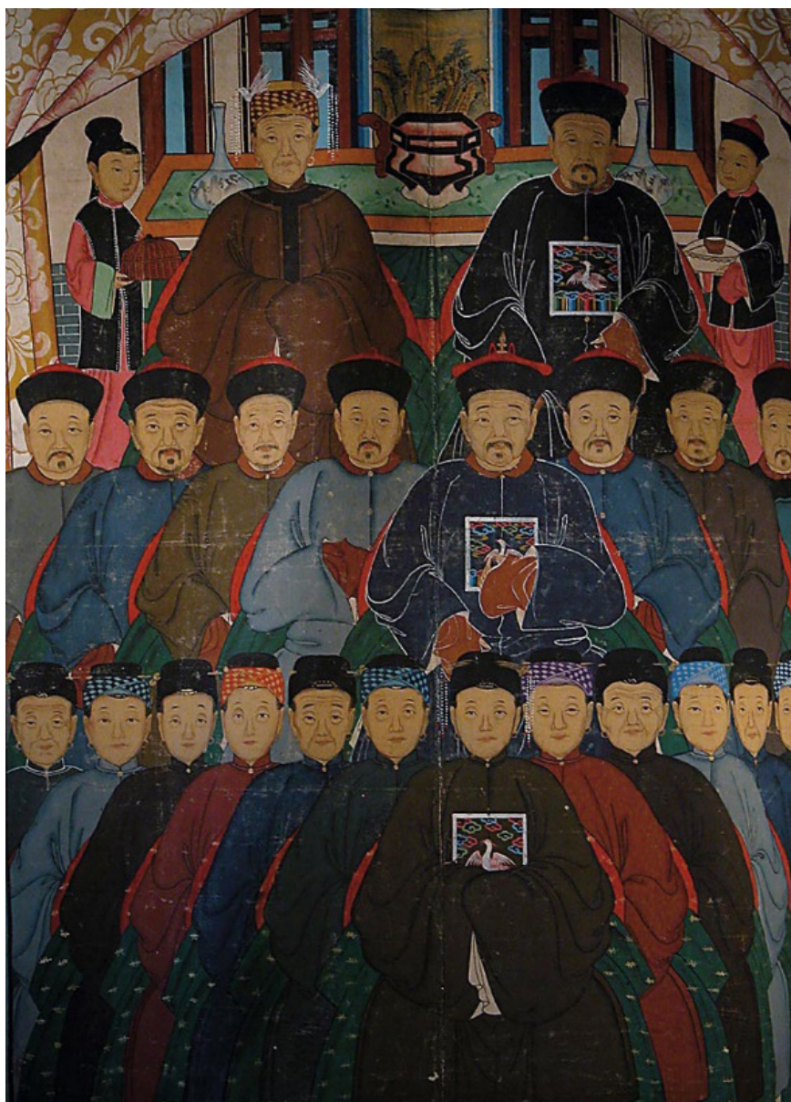
4.3 Portrét předků, dílo neznámého autora z 19.století. Tempera na plátně, 185 x 98 cm. Portréty předků se vyvěšovaly se pouze při hlavních obřadech. V tomto případě jde o hromadný portrét předků, jaký známe až z průběhu dynastie Qing. V první linii vidíme patriarchu a jeho maželku s malými postavami sloužících. Pod nimi se v druhé linii nachází jejich synové a na nejnižší úrovni jejich manželky, kterých je více než mužů.