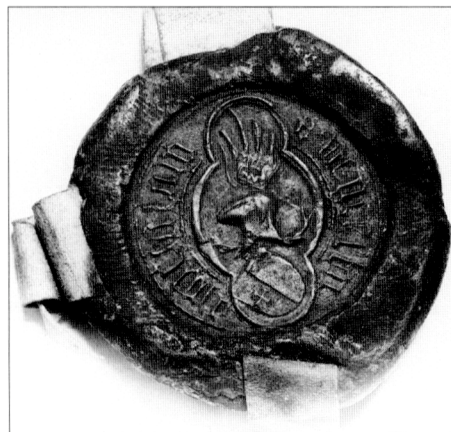
Obr. č. 19