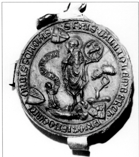
Obr. č. 5