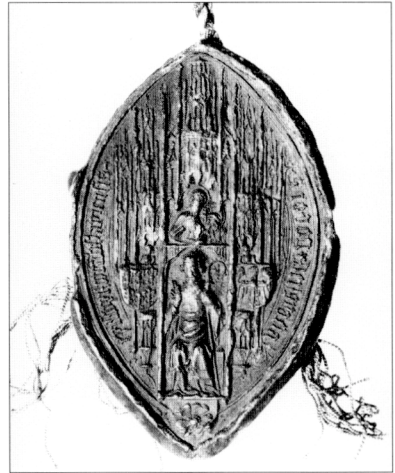
Obr. č. 24