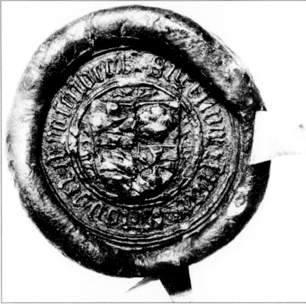
Obr. č. 21