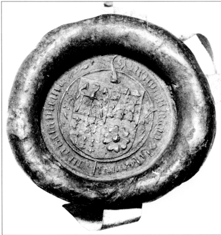
Obr. č. 23