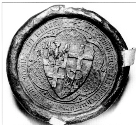
Obr. č. 10