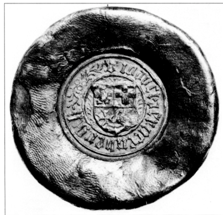
Obr. č. 20