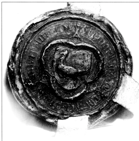
Obr. č. 14