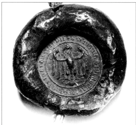
Obr. č. 9