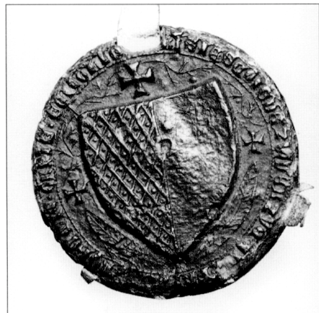
Obr. č. 7