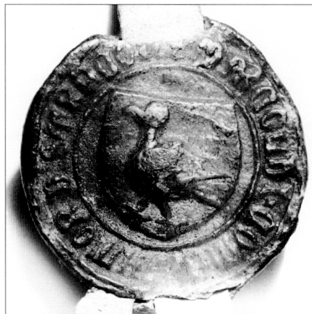
Obr. č. 12