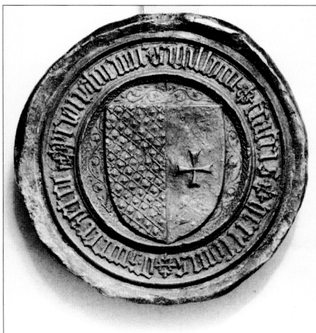
Obr. č. 16