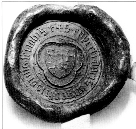
Obr. č. 18