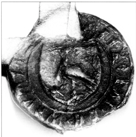
Obr. č. 11