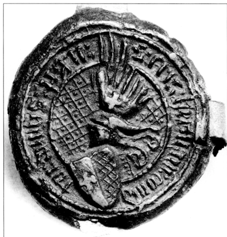
Obr. č. 15