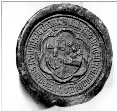
Obr. č. 17