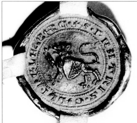
Obr. č. 4