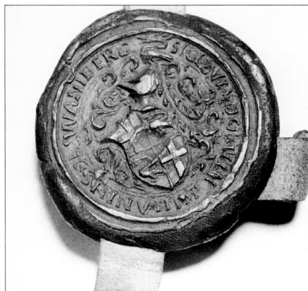
Obr. č. 26