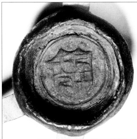
Obr. č. 27