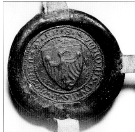
Obr. č. 8