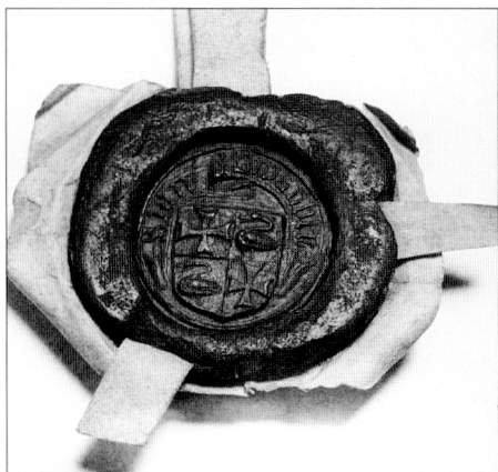
Obr. č. 25