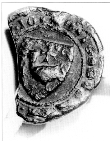
Obr. č. 13