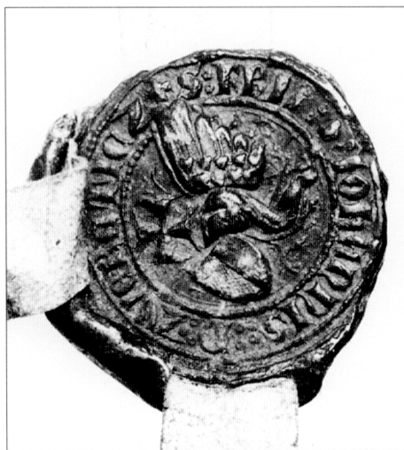
Obr. č. 6