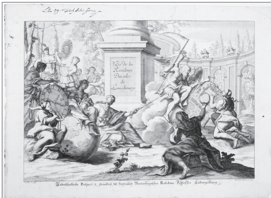
2. Donato Giuseppe Frisoni, Vuës de la Residence Ducale de Louisbourg. Unterschiedliche Prospect u. Grundriß deß Herzoglich Würtembergischen Residenz Schloßes Ludwigsburg, Augsburg: Jeremias Wolff, s. a. [Liber 79]