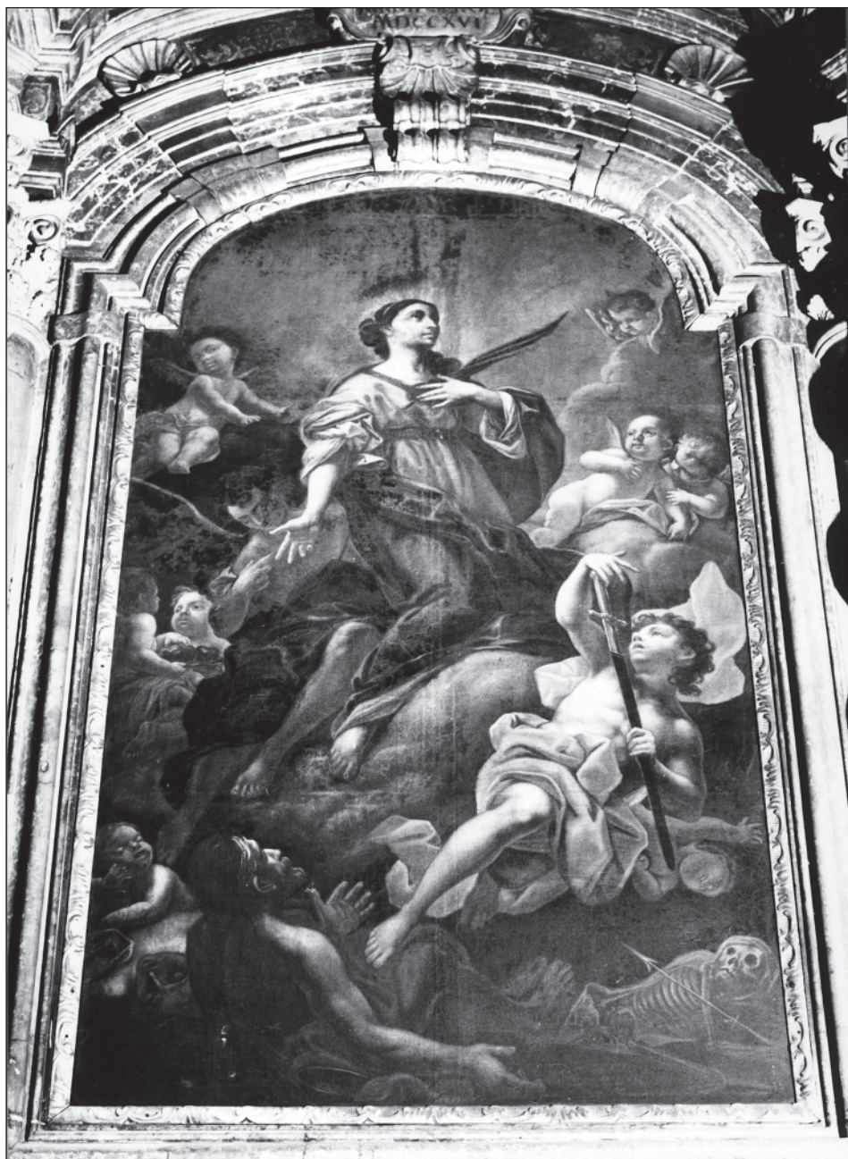
7. Václav Jindřich Nosek, Sv. Pavlína, 1716. Olomouc, kostel sv. Mořice Wenzel Heinrich Nosek, Hl. Paulina, 1716. Olmütz, St. Moritzkirche