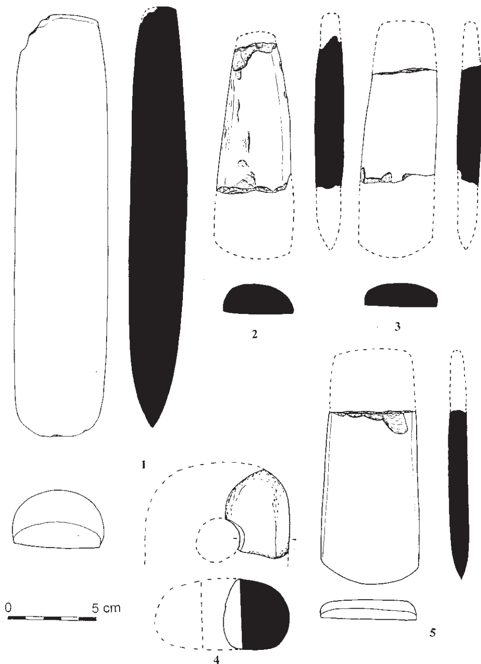
Obr. 1. Rouchovany. Broušená industrie z kultury LnK I. st. (1-3, 5) a eneolitu (4). Zelená břidlice typu Jistebsko (1-2, 5) a Želešice (3), amfibolický diorit (4).