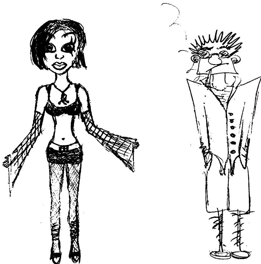
Obr. 3: Kresby 17–leté dívky se svérázným znázorněním mužství a ženství

znaků u postav, které odpovídají jejich vlastní pohlavní příslušnosti. Jedním z možných vysvětlení tohoto zjištění je, že samotný fakt „být mužem“ nebo „být ženou“ vede příslušníky jednoho či druhého pohlaví ke každodenní konfrontaci se svým tělem a vzhledem, a tudíž i k větší všímavosti vzhledem k detailům, které se vnějšího vzezření mužů nebo žen týkají (což se zpětně odrazilo v kresbě).