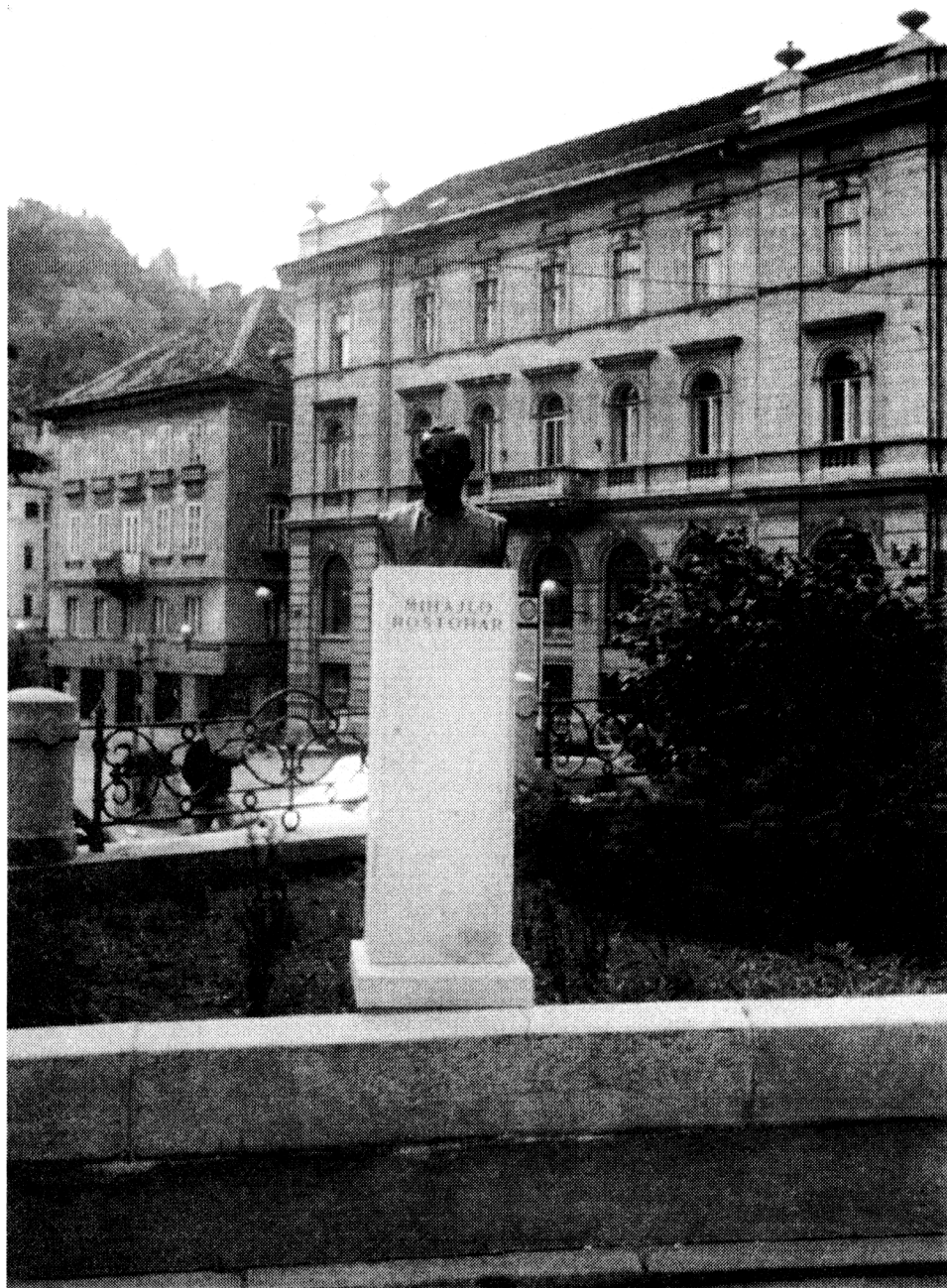
Obr. 2. Busta M. Rostohara před fakultou Lublaňské univerzity.