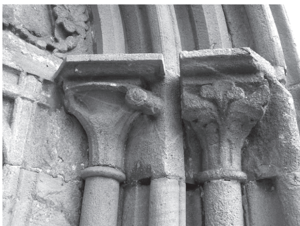
10 – Jižní hlavice západního portálu. Dolní Loučky, kostel sv. Mikuláše