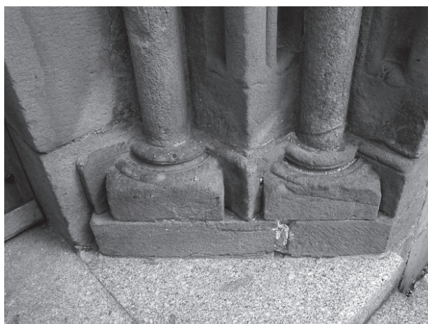
11 – Jižní patky západního portálu. Dolní Loučky, kostel sv. Mikuláše

jež stojí na počátku hruškovité profilace, zde uplatněné na ostění i archivoltách, a diagonální postavení soklové části, které tak vytváří pravidelný trychtýřovitý tvar, svědčí už o vlivu nejranější gotiky. Výše uvedené nesrovnalosti v utváření archivolt vzbuzují domněnku, zda původně nevytvářely oblouk půlkulatý, jenž byl po přenesení na nové místo přerušen, a dnešní lomený oblouk byl tak vytvořen uměle, a to buď na základě dobového estetického cítění, nebo prostě z nedostatku prostoru. Nesmíme taktéž zapomínat, že u některých pozdně románských portálů se jejich šířka vyrovnala výšce. Přenesení takového portálu do předem vymezeného prostoru, jako je západní stěna věže v Dolních Loučkách, by pak znamenalo jeho nutné zúžení. Existuje i druhá možnost, že již původní portál mohl být zalomený, čemuž by napovídaly rovné články uplatněné v archivoltách, zmíněné prostorové omezení by taktéž nedovolovalo jeho plné rozvi-