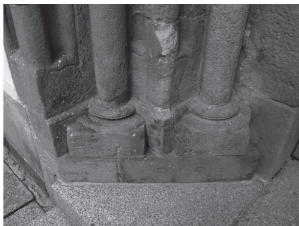
9 – Severní patky západního portálu. Dolní Loučky, kostel sv. Mikuláše