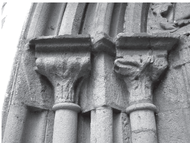
8 – Severní hlavice západního portálu. Dolní Loučky, kostel sv. Mikuláše