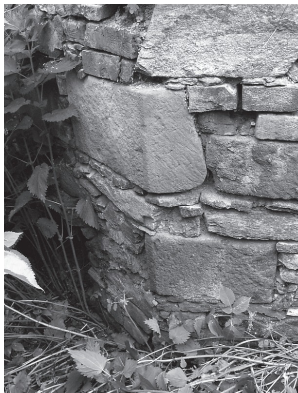
15 – Opracované kvádry ve hřbitovní zdi. Dolní Loučky, hřbitov