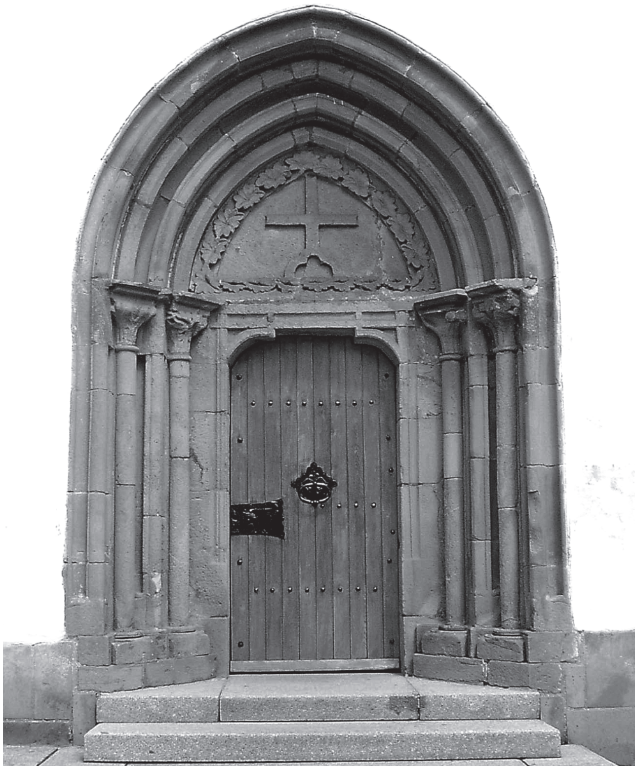
7 – Celkový pohled na západní portál. Dolní Loučky, kostel sv. Mikuláše

Podoba původního portálu se rekonstruuje velmi těžko, variací analogických příkladů dojdeme ke zjištění, že možností je celá řada. Portál svým uspořádáním stál na roz-