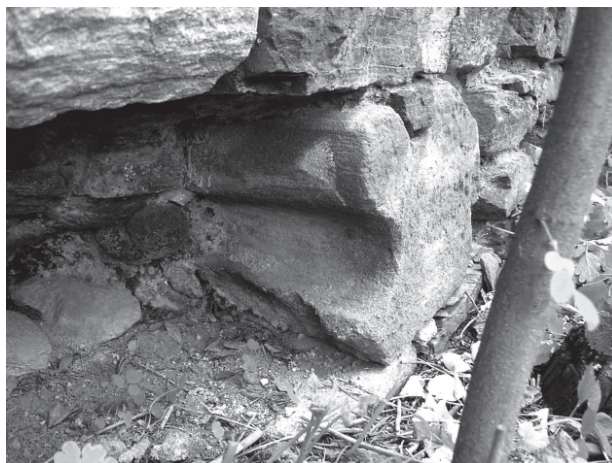
14 – Blok ostění ve hřbitovní zdi. Dolní Loučky, hřbitov

ké patky s mělkým žlábkem a polosloupy ve zdejším trojlodí jsou na úpatí zakončeny výrazným prstencem, jenž je od patky oddělen hlubokým vyžlabením. Tato profilace obíhá v podobě římsy úpatí všech pilířů, z nichž zmíněné polosloupy vyrůstají. Popsaný prvek je ostatně typický pro cisterciácké prostředí, objevuje se i v bazilice v Porta coeli v Předklášteří, kde ho najdeme jak na mezilodních pilířích, tak na úpatí vítězných oblouků bočních kaplí i presbytáře.