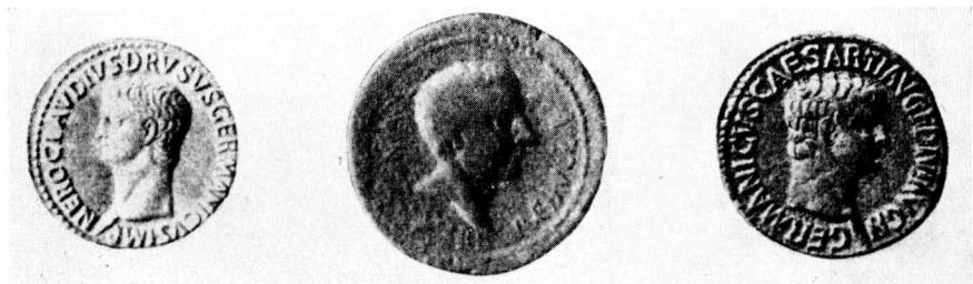
Obr. 2. Drusus, Varus a Germanicus na římských bronzových mincích. Museum Berlín. \frac{1}{4} , (C. Schuchhardt, VD 3 obr. 206.)