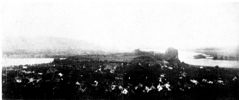
Obr. 1. Hradiště Dvůr při ústí Moravy do Dunaje, v pozadí hradiště Braunsberg.