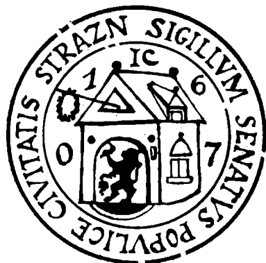
Tab. 44. Znamení volného výčepu vína „pod víchem“ na pečeti města Strážnice z r. 1607