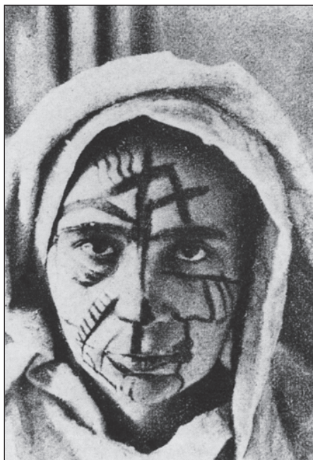
Dekorovaná tvář Natálie Gončarovové. Dobová fotografie.

spatřuje v jejím skrytém kinetismu. Futurismus objevil opačný postup – nikoli sepětí jednotlivých prvků v jejich následnosti, jak je tomu v kubismu, nýbrž dosažení pocitu dynamiky v samotném členění celku na části. Suprematismus na rozdíl od předchozího vývoje malířství nepoužívá reálné formy věcí. Vytváří formu v souladu s barvou na ploše, osvobozuje malířství od utilitarismu. Tím se liší od užitého umění. 66 Tvořit podle Rozanovové znamená absolutní distanci ode všeho, co je vně či uvnitř nás. Je to schopnost vidět to, co přichází. Tvořit je možné jen z tohoto pocitu naprosté novosti. 67 Postavení umění ve společnosti Rozanovová vyjadřuje již titulem další eseje, opublikované rovněž v časopise Anarchija . „ Umění existuje jedině tehdy, když je nezávislé a zcela svobodné! “ 68 Stati Rozanovové vycházely ze základních tezí tvůrce suprematismu Kazimira Maleviče (1878–1935), formulovaných ve dvou programových statích Od kubismu ke suprematismu (1915), Od kubismu a futurismu ke suprematismu (1916) a z jejich další specifikace v sérii článků, otiskovaných podobně jako citované stati Rozanovové v radikálním časopise Anarchija .