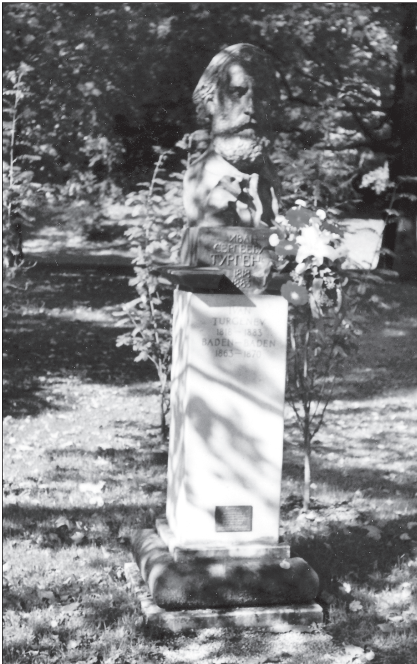
Soudobá busta I. S. Turgeněva v lázeňském parku Baden-Badenu.