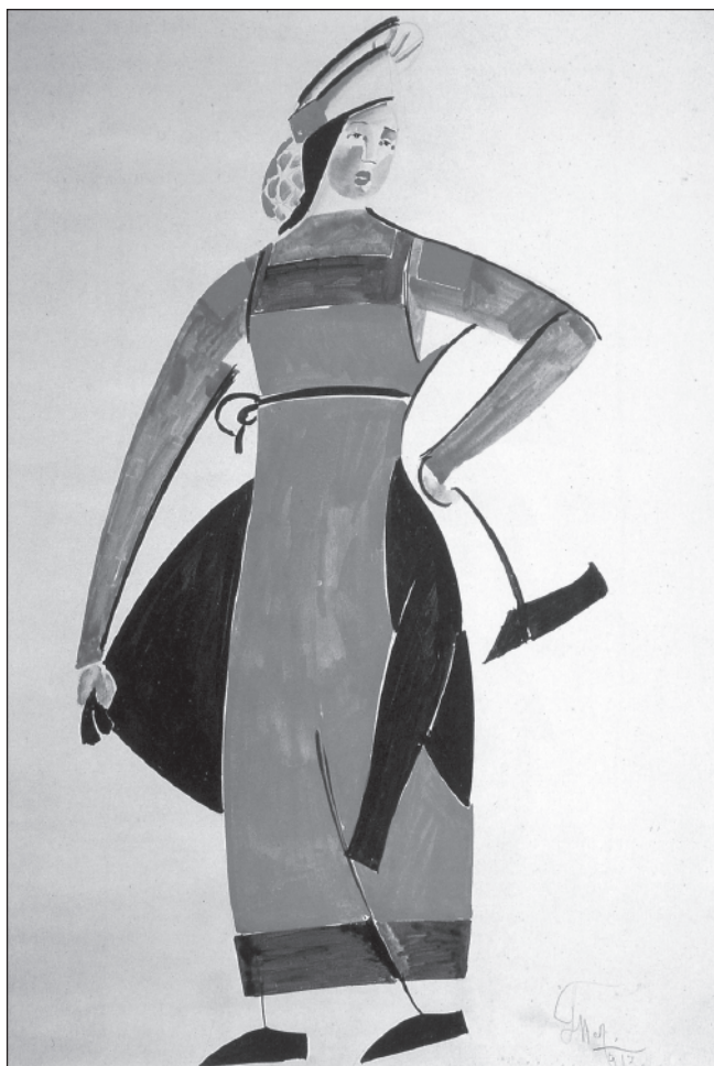
Tatlin, Vladimír Jevgrafovič: Návrh kostýmu venkovské dívky k operě M. I. Glinky Život za cara ( Ivan Susanin , 1913), nerealizováno. Akvarel 46 × 29 cm.

v polovině desátých let vytvářet tzv. „skul’ptoživopis“ – díla, jež byla syntézou sochařství a malířství. Přesvědčení o vzájemném vztahu a působení techniky a výtvarného umění Tatlina přivedlo k chápání formy a jejího utváření jako konstrukce. Koncem desátých let vytvořil řadu malířských či tzv. protikladných reliéfů. 76 Nejvýznamnější však byl jeho proslulý Pomník Třetí internacionály (1919–1920), jenž vznikl v rámci porevolučního projektu propagovat komunistickou ideologii pomocí monumentálních plastik. Vznikla tak série velmi špatných děl. Tatlinův Pomník Třetí internacionály byl čestnou výjimkou. Patřil k projektům ruského kinetismu inspirovaného rozvojem kinematografie. Celá věžovitá konstrukce se měla otáčet, na jejich plochách chtěli promítat propagační hesla. Model získal r. 1925