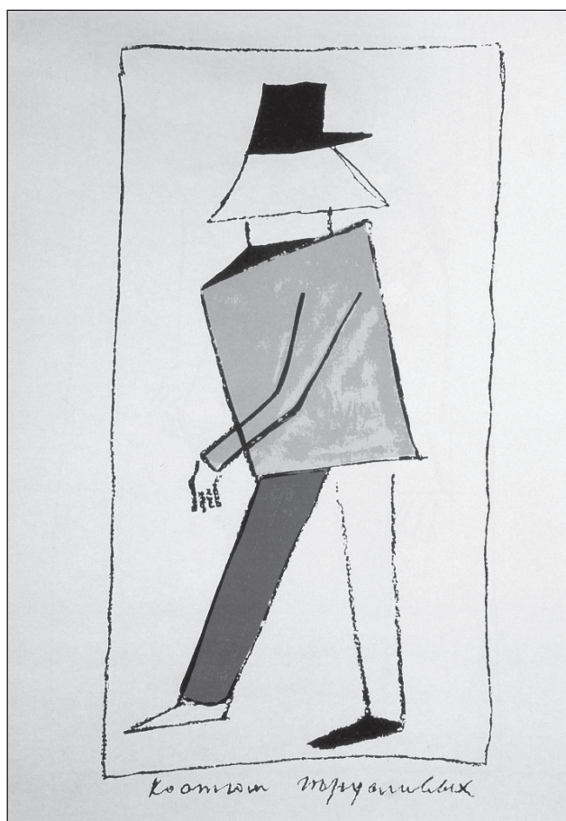
Malevič, Kazimír Severinovič: Návrh kostýmu Bázlivců k operě M. V. Maťušina a A. Je Kručonycha Vítězství nad sluncem . Akvarel, 42 × 29,2 cm. Divadelní muzeum, SPb. Hráno r. 1913 v petrohradském divadle Lunapark. Krabicový tvar saka odpovídá Malevičovu estetickému cítění, vyjadřovanému i slovně.

Na rozdíl od první proklamace z června 1915, v níž Malevič především zdůvodňuje svůj rozchod s kubismem a futurismem, druhá stat' vznikla pod poněkud rozšířeným názvem ještě téhož roku, otištěna však byla jako samostatná brožura o rok později v Moskvě. 69 Zásadní význam má nejen již dříve deklarované Malevičovo odmítnutí předmětného zobrazování, ale i jeho průvodní gesto, s nímž malíř vystupuje z kruhu svírajícího umělce i přírodu. Nejde zdaleka jen o změnu malířského nazírání. Malevičova záměna kruhu čtvercem v sobě nese celou řadu konotací. Jde především o změnu mýtotvorné orientace. Magický kruh – to gesto primitivního člověka, jenž se uzavírá před nepřátelským světem do kruhu,