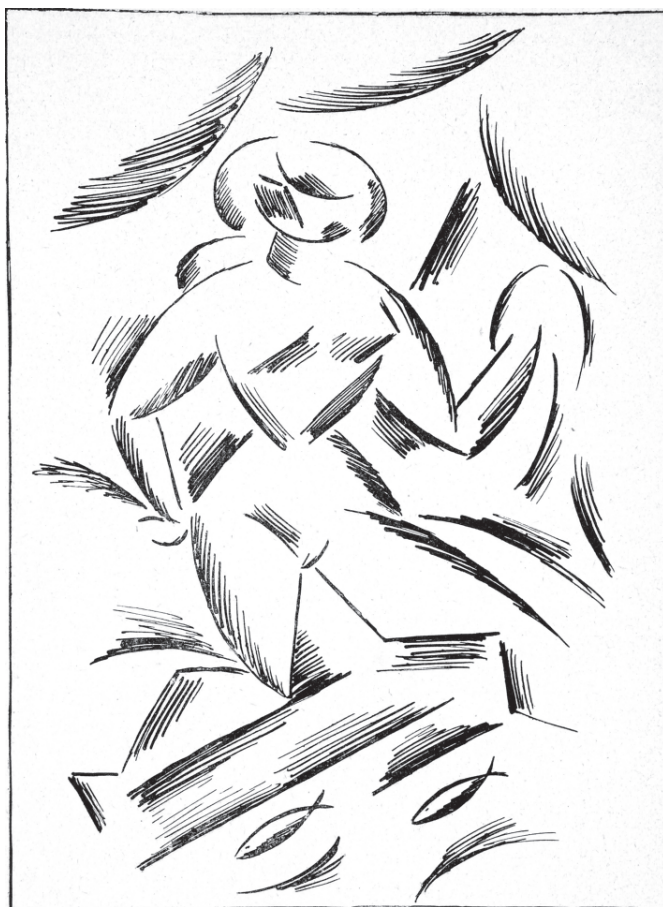
Špála, Václav (1885–1946): Léto . Kresba žnečky z cyklu Čtyři roční období uvozující vždy čtvrtletí kalendáře, začínajícího zpodobněním zimy jako kráčející ženy, pokračující dívčí podobou jara a končící rovněž perzonižovanou podobou podzimu jako ženy obtížené plody. Almanach na rok 1914 , vydáný Skupinou výtvarných umělců v čele s bratry Čapky.

právná („samovityje“) slova. Je třeba vysvobodit slova z chudobince filozofických či jiných experimentů. Verše nejsou lenoch pod papírem, na němž se zapisují vědecké poznatky. Neponižujte vědu a umění! ... Naučte se chápat naše automobilní slova...“ 42 Autor se distancuje od naturalismu i symbolismu, zdůrazňuje civilizační momenty své současnosti. Jedním dechem odmítá v básnictví slovanofilství i poetičnost včetně plných rýmů. Slyší bubnování, jímž se otrásají moderní města, v nichž není místa pro romantiku. Ztotožňuje se s jejich architekturou, za jedinou krásu světa pokládá „krásu formy a krásu rychlosti“ (76) .