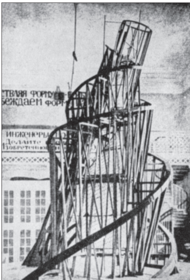
Tatlin, Vladimír Jevgrafovič (1885–1953): Pomník III. internacionály . 1925. Návrh věžovité konstrukce, jež se měla v duchu kinetického umění otáčet a přispívat tak k propagaci nové ideologie i avantgardních forem umění.