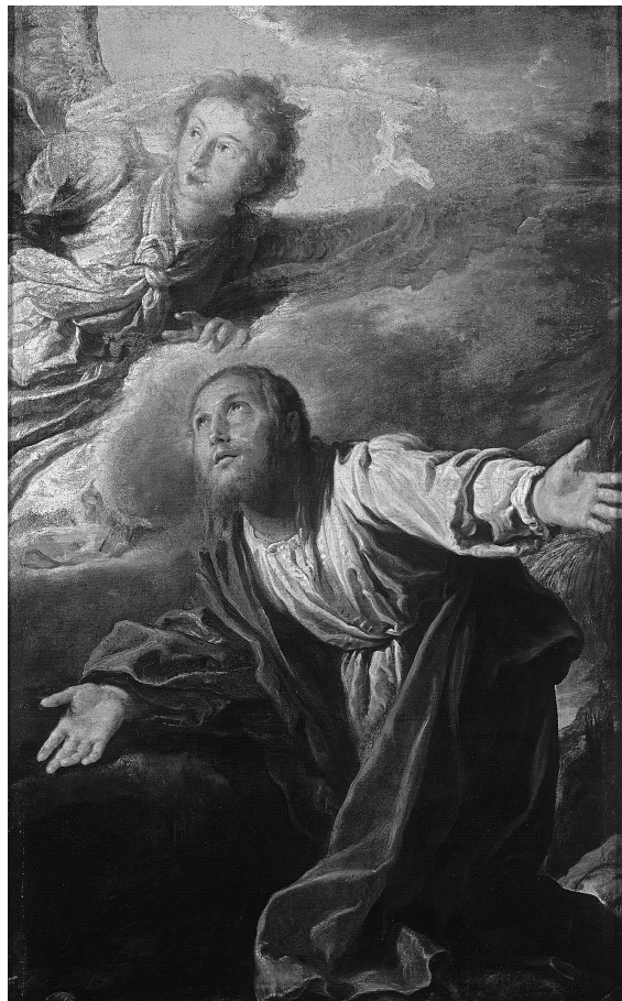
Obr. 1: Domenico Fetti, Kristus na hoře Olivetské , Obrazárna Pražského hradu, inv. č. HS 34.