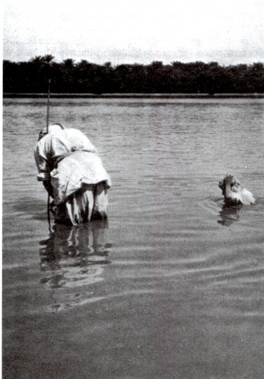
Obr. 4: Z mandejského křtu.