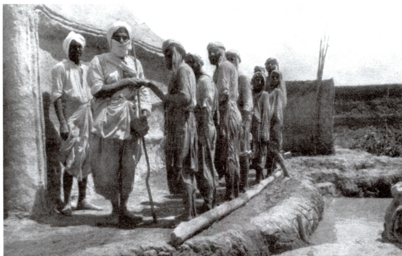
Obr. 3: kušťa.

Převzato z: K. Rudolph, Der mandäische „Diwan der Flüsse“, Berlin 1982.