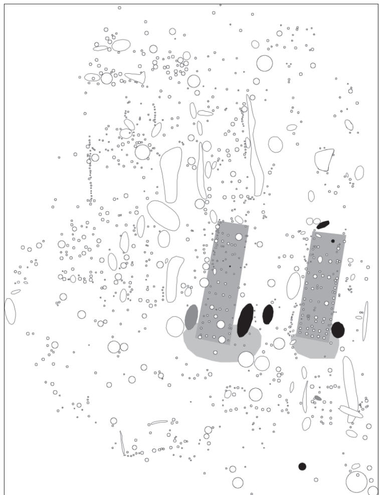
Fig. 26. Turnov – Maškovy zahrady. Střední fáze kultury s keramikou lineární. Koncentrace kamenné industrie v objektech na ploše E. Legenda: šedě zvýrazněné objekty – objekty bez industrie, černě zvýrazněné objekty – objekty s industrií, šedě obdélníky a plochy v podkresbě – dlouhé domy s pracovními areály. Obr. 26. Turnov – Maškovy zahrady. Middle phase of the Linear Pottery culture. Concentration of stone industry in features on area E. Legend: grey pointed up features – without stone industry, black pointed up features – with stone industry, grey rectangulars and areas in subdrawing – long houses with working areas.

strie, ale i s dalšími činnostmi (např. řezání) souvisí čepele. Opětovně je můžeme nalézt v obou areálech a to ve srovnatelném zastoupení. S přípravou specializovaných čepelí sloužících k zasazení do srpu souvisejí upravené čepele. Opět je můžeme nalézt v obou areálech (v areálu 1 se nalézají dvě a v areálu 2 se nachází jedna). Čepel s leskem pochází pouze z areálu 2. Doklad vrtání kamenné industrie můžeme v podobě vývrtku nalézt v areálu 1. Další vývrtek pochází z objektu mimo areály na severním okraji dlouhého domu přiléhajícího k areálu 2. Broušené nástroje pocházejí především z objektu 1001 na J okraji plochy (2 kusy), jeden byl nalezen uvnitř areálu 2. Jeden nalezený polotovár broušeného nástroje pochází z areálu 1. Ostatní nástroje, dokládající široké spektrum činností na sídlíšti, jsou rovnoměrně rozděleny mezi oba areály (po třech). Přepálené artefakty pocházejí z jednoho objektu v areálu 2 a z objektu 1001 na periferii zkoumané plochy (v obou případech se jedná o dva