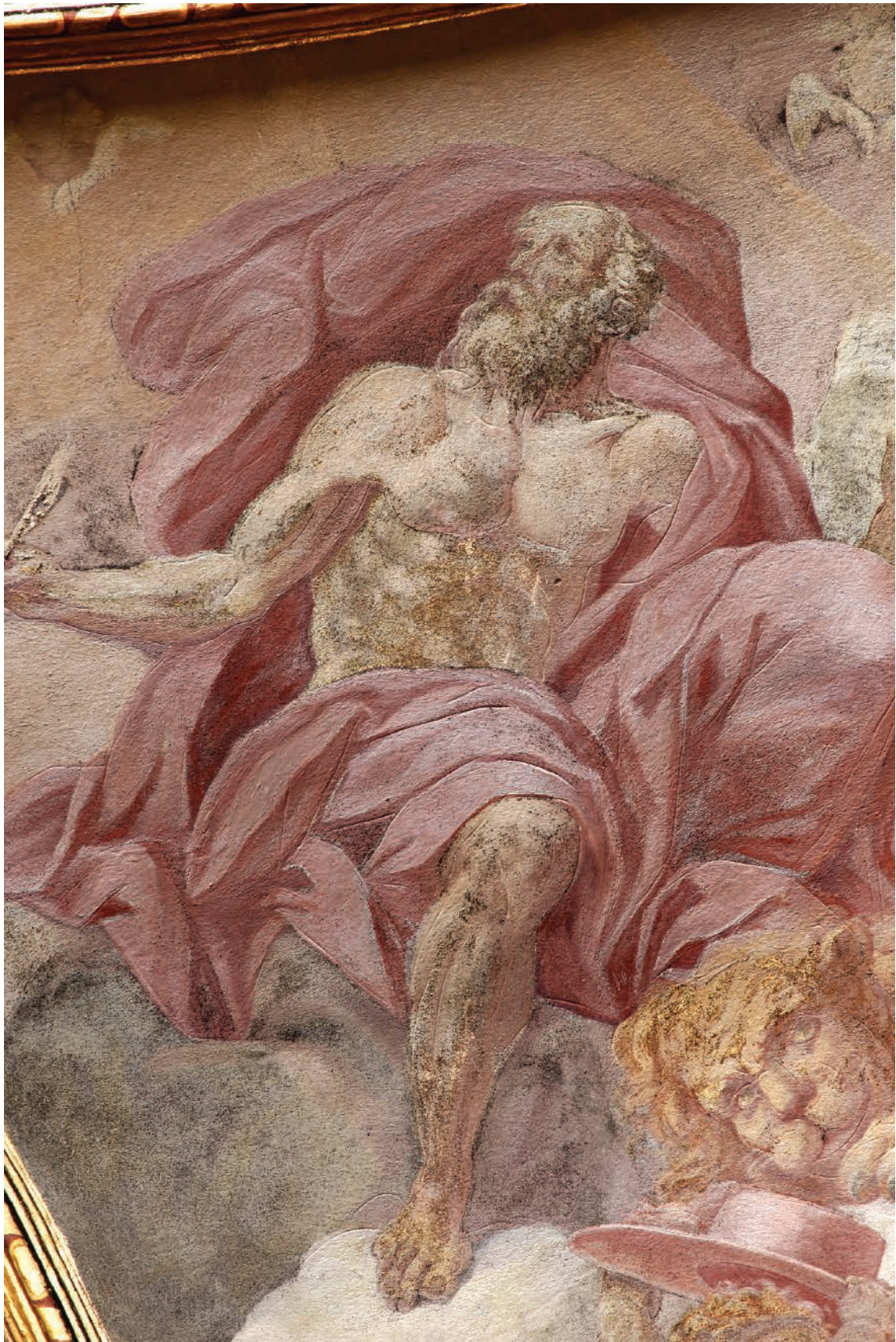
8 – Innocenzo Monti, Sv. Jeroným , nástěnná malba – detail, před 1709. Olomouc, kostel sv. Michala