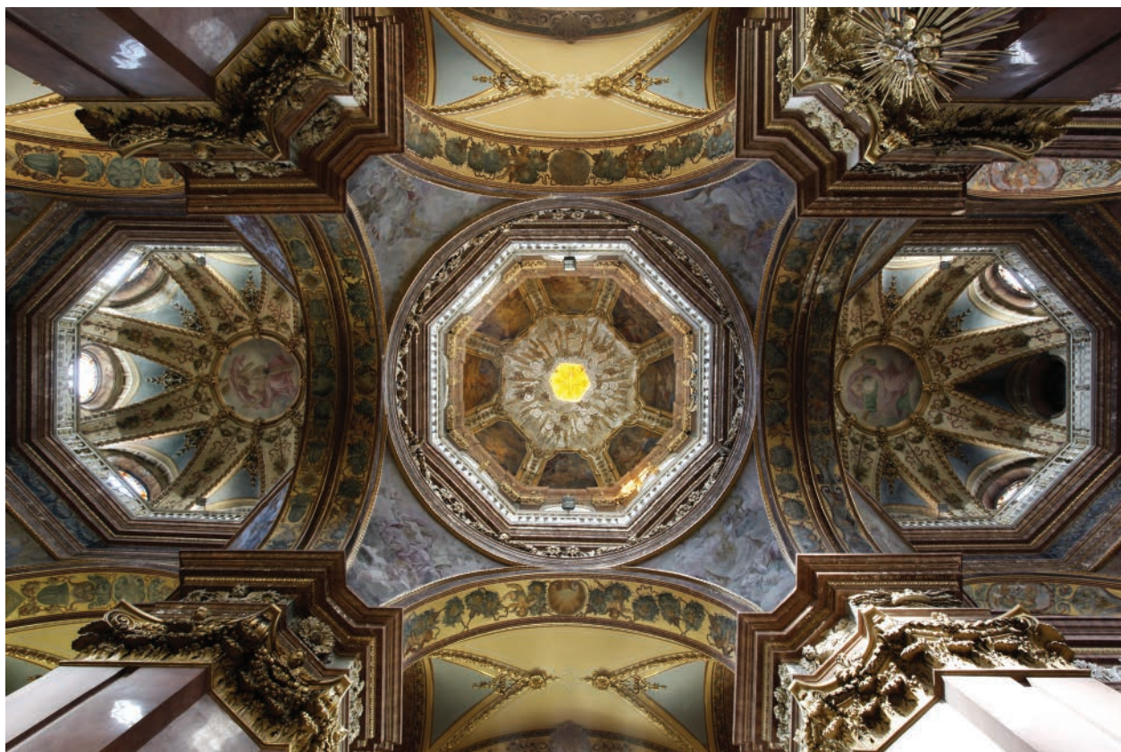
1 – Interiér kostela sv. Michala v Olomouci, pohled na všechny tři kupole