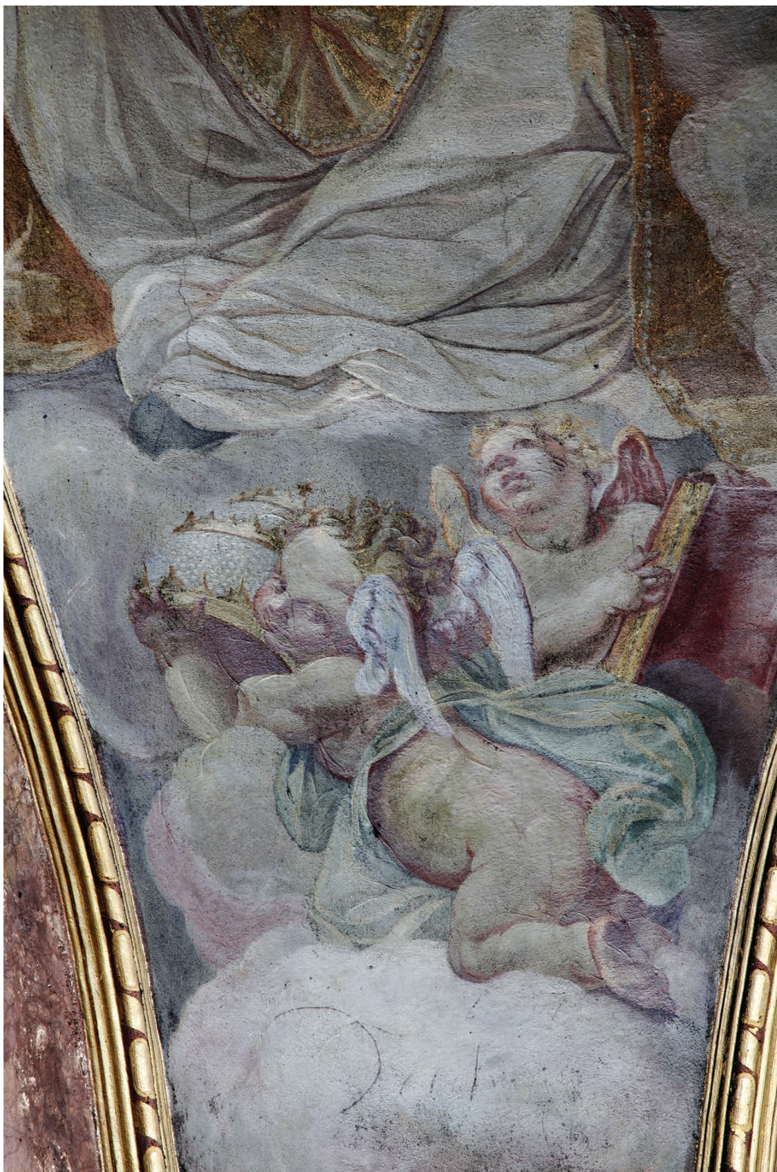
5 – Innocenzo Monti, Putti se znaky sv. Řehoře , nástěnná malba, před 1709. Olomouc, kostel sv. Michala