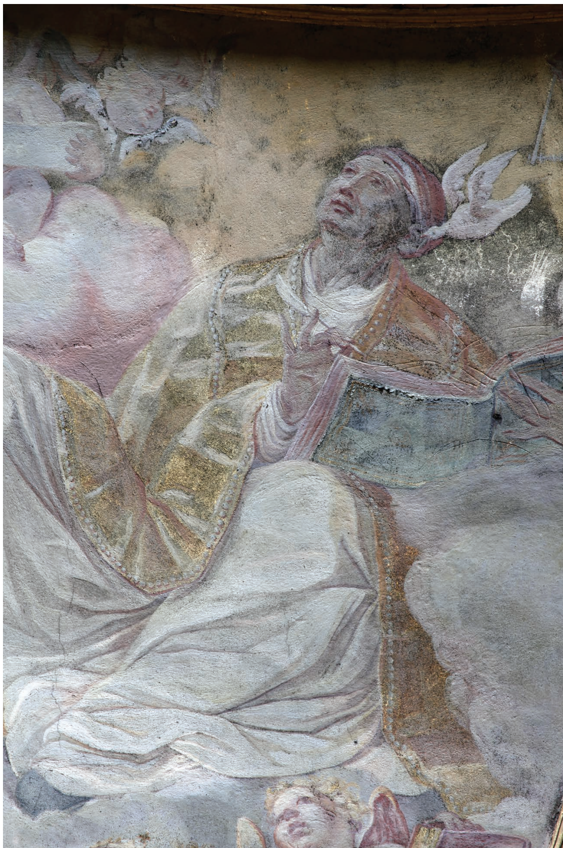
4 – Innocenzo Monti, Sv. Řehoř , nástěnná malba – detail, před 1709. Olomouc, kostel sv. Michala