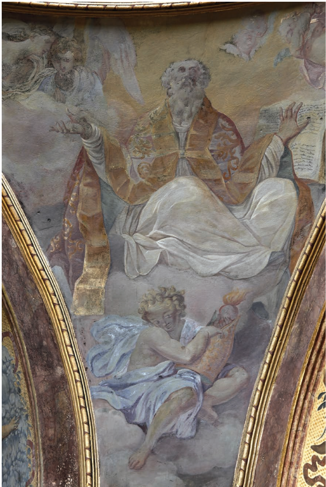
6 – Innocenzo Monti, Sv. Augustin , nástěnná malba, před 1709. Olomouc, kostel sv. Michala