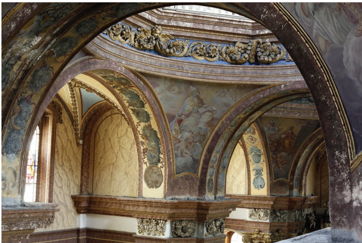
2 – Interiér kostela sv. Michala v Olomouci, pohled do centrální kupole

dassara Fontany. Fontanovým dílem jsou štukové dekorace hlavic sloupů, horizontálních vlysů v lodi a štuky v kupolích. Vzhledem k absenci archivních dokumentů datoval Mariusz Karpowicz jeho činnost pro dominikány do blíže neupřesněné doby v letech 1699–1706 a následně po roce 1710. 14 Předpokládal, že výzdoba byla požárem roku 1709 zničena, a tudíž ji Baldassare Fontana musel po roce 1710 opětovně realizovat nebo obnovit. K pevnému zakořenění mylné představy, že kostel vyhořel nebo byl těžce poškozen požárem z července 1709, přispěli staří olomoučtí historikové. 15 Lze předpokládat, že požár nedosáhl takového rozsahu, aby poškodil štukovou a malířskou výzdobu interiéru. Bylo by obtížně představitelné, že by nástěnné malby v pendentivech prokazatelně pohromu bez větších ztrát překonaly, zatímco štuky by lehly popelem. Lze vyloučit rovněž možnost, že by původní autoři svá díla vytvořili opětovně po požáru, neboť Innocenzo Monti v březnu 1710 zemřel. Soudím proto, že původní barokní fresky zůstaly navzdory požáru zachovány intaktně a byly pouze z dnešního pohledu poničeny razantními přemalbami Josefa Dragana z konce 19. století.