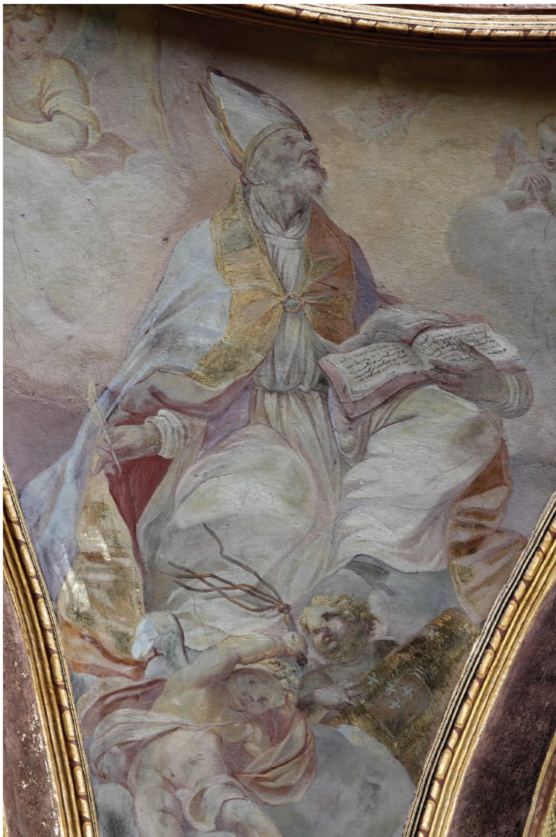
7 – Innocenzo Monti, Sv. Ambrož , nástěnná malba, před 1709. Olomouc, kostel sv. Michala