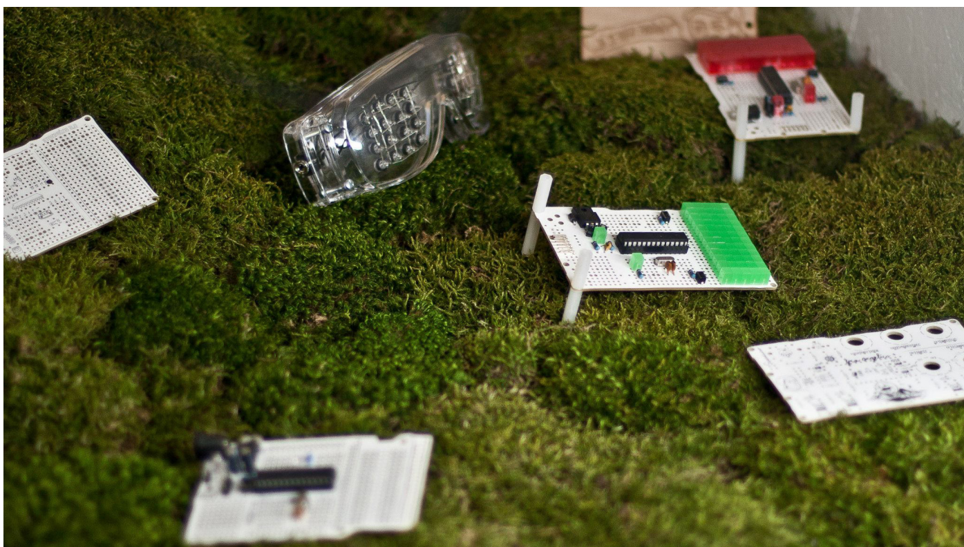
Aranžmá pracovního stolu 1.