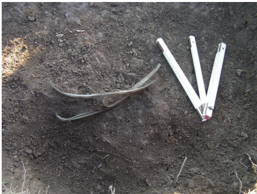
Obr. 2. Chvalšiny II. Skupina žeber z depotu druhotně přemístěného orbou. Podle Chvojka – Havlice 2009 .