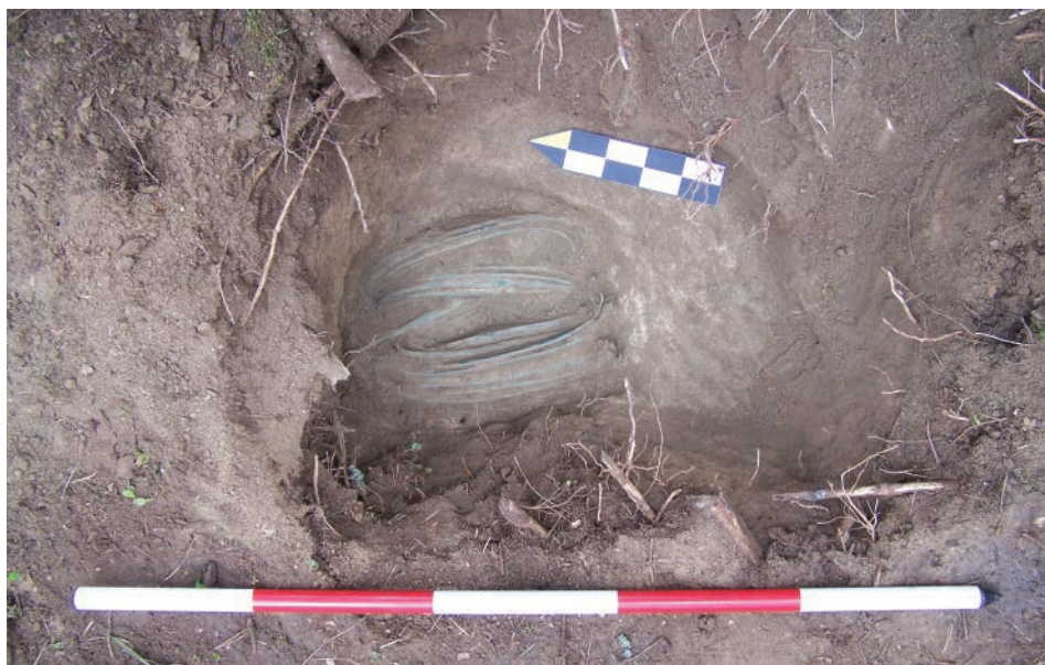
Obr. 4. Kučeř. Uložení žeber in situ.