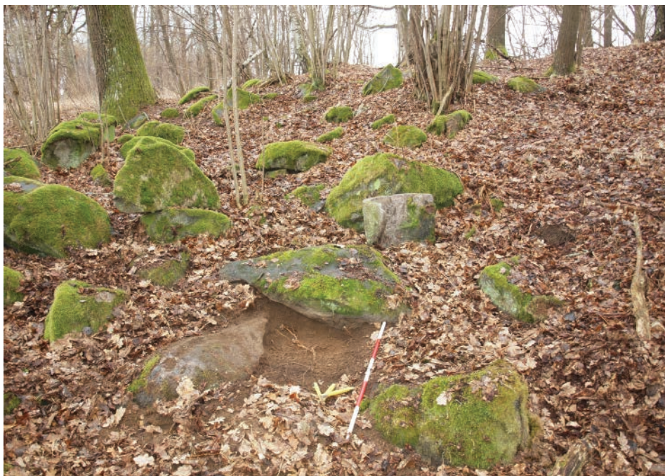
Obr. 7. Rychnov nad Malší. Místo nálezu depotu žebber.