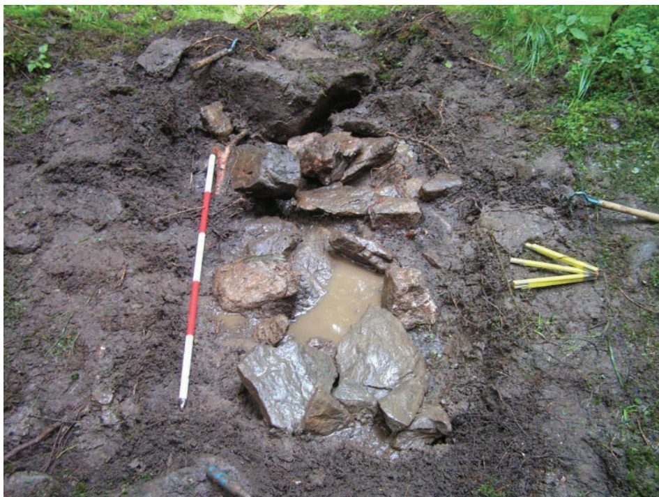
Obr. 5. Přídolí. Začištěná kamenná schránka, v níž byl uložen depot žeber. Podle Chvojka – Havlice 2009 .

– Ulož.: M Písek, inv. č. A 20529–20562.