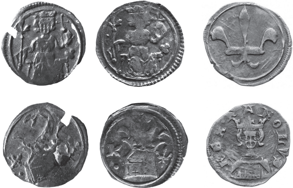
Obr. 3. Oboly Karola Róberta z rokov 1339–1342. Abb. 3. Obole von Karl Robert aus den Jahren 1339–1342.

Oboly Karola Róberta z Glanzenbergu patria medzi extrémne vzácné mince, ktoré sú dosiaľ známe len v štyroch exemplároch. Ich výnimočnosť tkvie aj v tom, že spolu s visegrádskym exemplárom pochádzajú z archeologického výskumu. Napriek objaveniu nových kusov týchto mincí však naďalej zostáva okolo nich množstvo nezodpovedaných otázok, na ktoré prinesie odpoveď až ďalší výskum, prípadne ich nové nálezy.