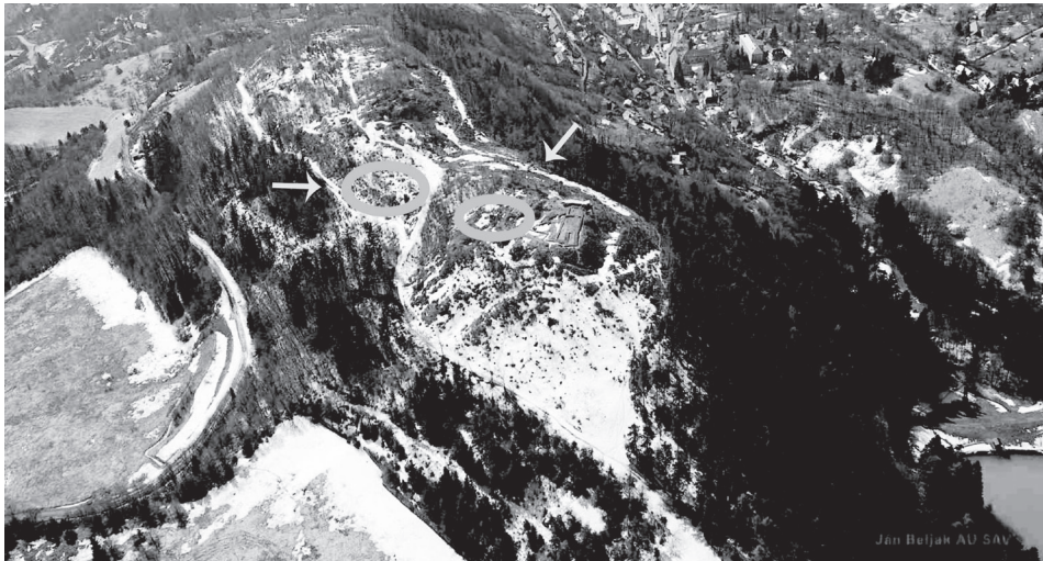
Obr. 1. Pôdorys Glanzenbergu s opisovanými objektmi. 2 – cesta, 3 – val, 4 – plošina nad dobývkami, 5 – poloha Kostolík, 6 – fortifikačné veže, cisterna a hradná kaplnka. Abb. 1. Grundriss des Glanzenbergs mit Objektbeschreibung. 2 – Weg, 3 – Wall, 4 – Fläche über den Abbaustätten, 5 – Lage Kostolík, 6 – Festungsturm, Zisterne und Burgkapelle.

rakterizovať majiteľa objektu. Medzi ne patrí polovica kamenného mlyna na drvenie rudy, sklo, technická keramika, troska a najmä olovené počítacie žetóny, ktoré pravdepodobne súviseli s registráciou množstva odovzdanej rudy na jej testovanie (Hunka 2009, 18). Možno konštatovať, že obidve miesta nálezu strieborných obolov predstavovali v 14. storočí veľmi dôležité a najmä