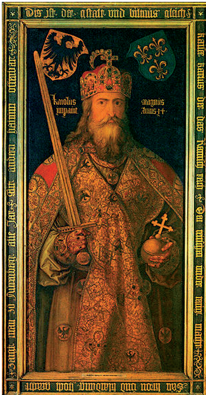
Portrét ideálního vladaře (Karla Velikého), který v roce 1513 na zakázku norimberské městské rady namaloval Albrecht Dürer. Zdroj: Albrecht Dürer. Kaiser Karl der Große. In: Wikimedia Commons [online] 12. 10. 2009 [vid. 31.1.2014].

Dostupné z: http://commons.wikimedia.org/wiki/File:Albrecht_D%C3%BCrer_047.jpg