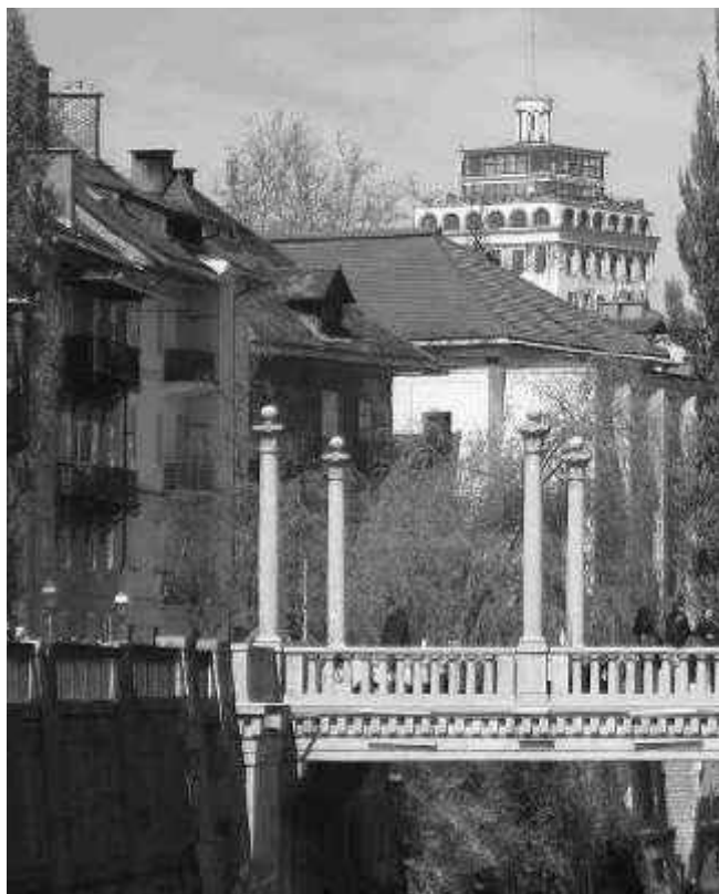
Fotografie z exkurzí: Baščaršija v Sarajevu, Bosna a Hercegovina / Plečnikův Čevljarški most v Lublani, Slovinsko