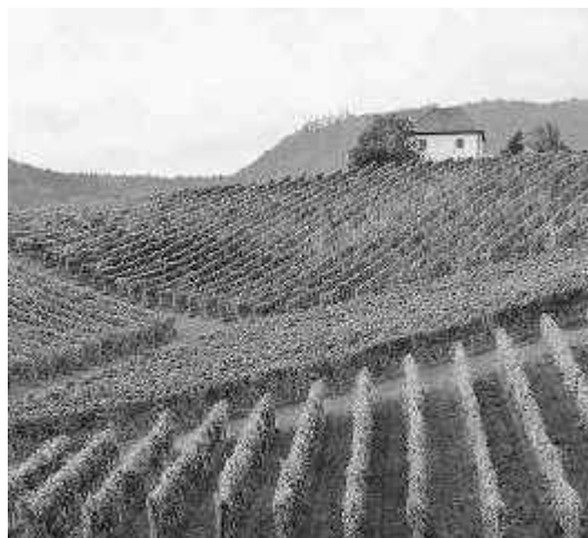
Slovinské vinice