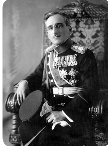
Obr. 3 Kráľ Alexander I., ktorý po nastolení diktatúry v roku 1929, presadzoval v štátnej politike ideológiu etnického juhoslavizmu.