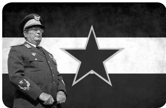
Obr. 6 Josip Broz Tito podriadil v rámci budovania Juhoslávie nacionalistické tendencie spoločným triednym cieľom v rámci ideológie Bratstva a Jednoty.

Špecifickú reprezentáciu juhoslavizmu prišlo do slovinských učebníc dejepisu obdobie Juhoslovanskej federatívnej ľudovej republiky (1945–1963), resp. Juhoslovanskej socialistickej federatívnej republiky (1963–1992). Otázka nacionalizmu v režime nastolenom Josipom Brozom Titom už bola načrtnutá v predchádzajúcom texte. Učebnice prezentovali žiakom príbeh dejín, kde sa prelínali triedne vzťahy s národným určením a vyjadrenie nacionalizmu bolo poplatné zaradeniu do triednej spoločnosti.