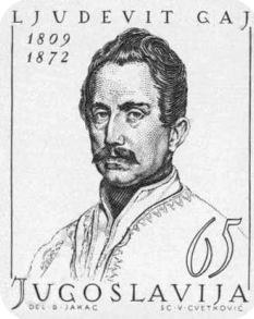
Obr. 2 Poštová známka s obrazom Ljudevita Gaja, hlavného predstaviteľa Ilýrskeho hnutia, ktoré zdôrazňovalo myšlienku spoločného pôvodu južných Slovanov.