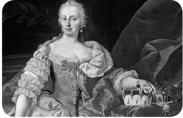
Obr. 4 Cisárovná Mária Terézia býva v texte učebnic často prezentovaná ako negatívna postava, ktorá germanizovaním monarchie obmedzovala juhoslovanské národy.