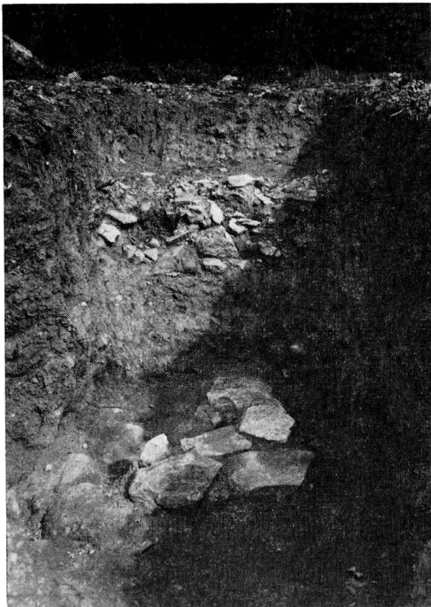
Obr. 4. Sázava, okr. Kutná Hora. Výzkum sídliště v severní zahradě, severní profil.

před nedostavěným gotickým kostelem. Téměř v ose nedostavěné severní gotické lodi byly nalezeny základy půlkruhové apsidy (š. 110 cm), plentované dvěma řadami lomového kamene; vnitřní jádro zdiva bylo sypané z drobnějšího lomového kamene, promíšeného maltou. Vnitřní rozpětí apsidy bylo 6 m. Jižní boční zdivo se objevilo v negativním základu, vysypaném maltou; při severní straně bylo porušeno základy barokní konírny a zachovalo se jen torzovitě. Tři sondy, založené směrem jižním, zachytily kostrové pohřebiště, provázené u jedné kostry esovitou bronzovou záušnicí a dvěma mincemi, z nichž jedna patří stříbrnému brakteátu.