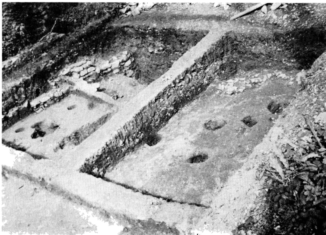
Obr. 3. Sázava, okr. Kutná Hora. Sidlištní objekty v severní klášterní zahradě.