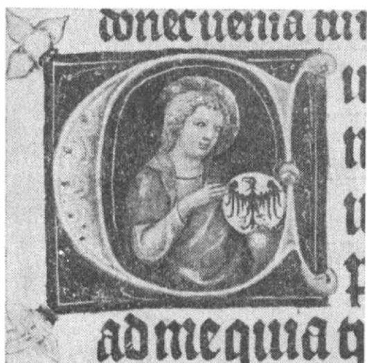
Obr. 6. Liber Vlticus Jana ze Středy, fol. 268b, sv. Václav v iniciále, foto M. Fokt.

c) Reliéfni plastika: Souhrnně lze říci, že erby s orlicemi opolskou, slezskou, svídnickou a moravskou z erbovního sálu na hradě Laufu u Norimberka (někdy okolo 1360 výzdoba; Kraft—Schwemmer 1960, 9 a 45 sq, tab. XII) se příliš neliší od orlic ze svatovítského triforia (Kalista—Funk 1946, 16 a 19 sq, obr. 7, 10—12, 15), jež bývají datovány do 70. let 14. století, nebo mostecké věže, okolo r. 1380. Tyto orlice hledí převážně vpravo s hlavou vodorovně postavenou a křídly více méně svislými, či mírně zahnutými na koncích. Na hradě Laufu se ovšem zachovala i polychromie.