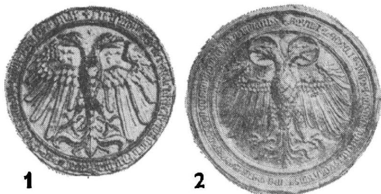
Obr. 3. 1 — Zikmund, pečeť před korunovací (Forsetzung) (z r. 1434), foto M. Fokt; 2 — Zikmund, císařská pečeť (z r. 1434), foto M. Fokt.

10. Avers císařské pečeti z r. 1434 (Posse 1910, tab. 17, č. 2) má orlici se zřetelně se projevujícím přechodem k renesančnímu tvaru, jež se dotvoří kolem pol. 15. stol. (obr. 3:2).