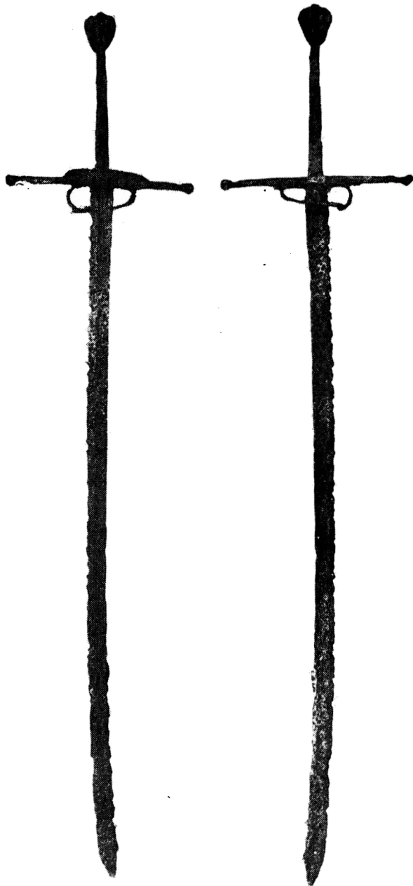
Obr. 1. Rakovník, okr. Rakovník. Pozdně gotická šavle. Stav po konzervaci. Kresba H. Komárková.