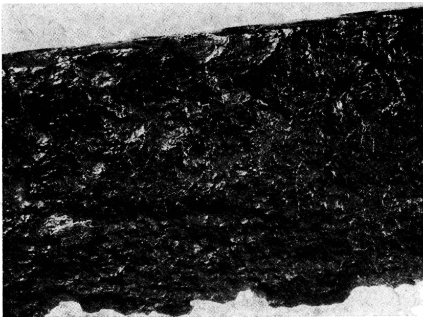
Obr. 4. Rakovník, okr. Rakovník. Detail dochovaného zbytku značky na čepeli pozdně gotické šavle.