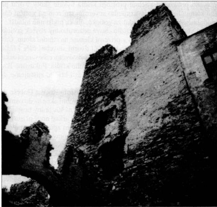
Obr. 6. Dobrs - průčelí víže tvrže do vnitřního nádvoří - trvaly stav. (Kolo F. Kasička, 1981).