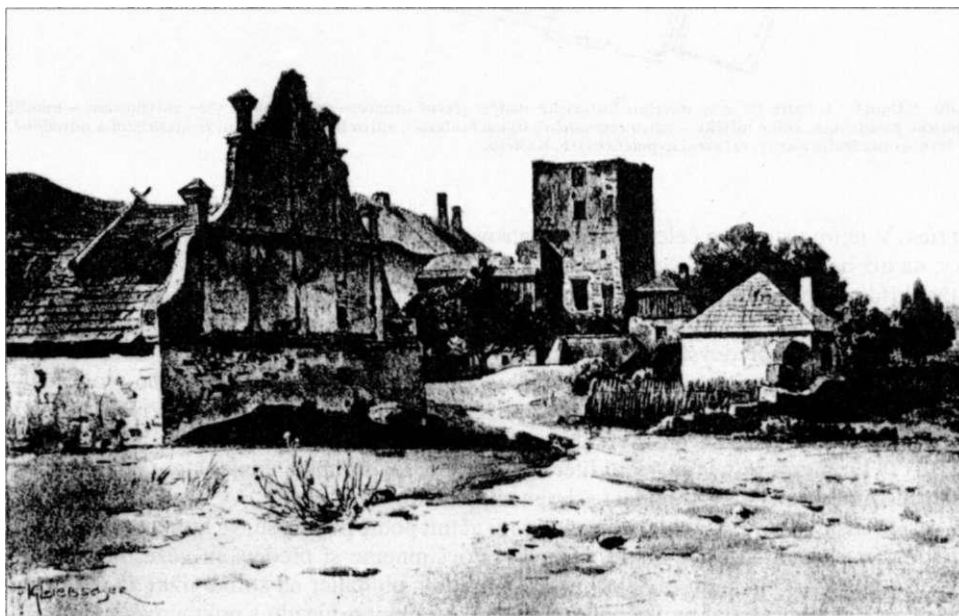
Obr. 4. Dobruška - pohled na tvrz od severozápadu, od bývalého hospodářského dvora, stav závorem 19. stol. (podle kresby K. Liebschera v publ. A. Sedláček: Hradky, zámky a tvrže..., díl XI. (1897, str. 278).

V dalších etapách gotické výstavby mohlo dojít ke zvyšování hradebního obvodu, k zahušťování vnitřní obvodové zástavby na straně západní i východní, k přebudování vstupní