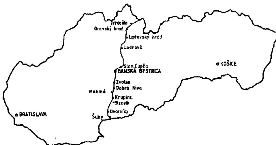
Obr. 1. Hlavné body na trase historickej komunikácie via magna.

Druhá komunikačná trasa, prechádzajúca územím stredného Slovenska, ktorou sa budeme bližšie zaoberať, niesla tiež pomenovanie via magna. Bola to severojužná cesta, spájajúca centrálné časti Uhorska s Poľskom, resp. pobrežím Baltického mora. V 11. až 12. stor. mala táto cesta vojensko-strategický a priam existenčný význam pre udržanie a trvalé začlenenie kotlín Hrona a Váhu do rámca konštituujúceho sa uhorského štátu. Najkratším smerom spájala centrálné oblasti Uhorska so Zvolenom ako sídlom komitátneho župana, ďalej Liptovom, Oravou a ich prostredníctvom aj s Poľskom. Smerovanie ciest kontinuálne vychádzalo z podmienok staršieho osídlenia, ktorého význam zvyrazňuje cirkevno-správna organizácia Zvolenského komitátu (obr. 1).