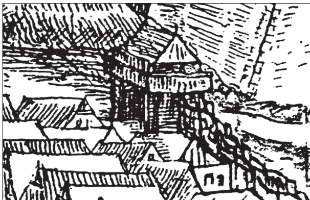
Obr. 2. Výrez z druhej Willenbergovej veduty zobrazujúci jednu z drevených brán na západnej strane mestského opevnenia v roku 1599.

námestia – in fossatis circuitus civitatis (MZ 1499). V tomto prípade však podľa vynaloženej sumy išlo už o väčšie stavebné úpravy priekopy. Mesto za ne totiž vyplatilo spolu sumu 6 zlatých a 25 denárov. Zvolenský mešťania zároveň v tom istom roku opravovali aj priekopu, ktorá ležala na ulici blízko domu mešťana Škrtlíka – in platea penes skrtliq. Zatiaľ nevieme, či išlo o označenie úseku veľkej priekopy okolo celého námestia, alebo o inú samostatnú priekopu – súčasť mestského opevnenia. Mestská priekopa vyžadovala podľa