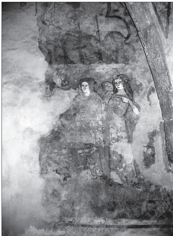
Obr. 8. Most pri Bratislave, tri ženské postavy z radu múdrych panien v dolnom obraze južnej steny.

V tomto zmysle sú východiskové obrazy na východnej stene presbytéria, v dolnom poli Zvestovanie P. Márii a nad ním pohľadovo dominantné Ukrižovanie, ktoré predstavujú