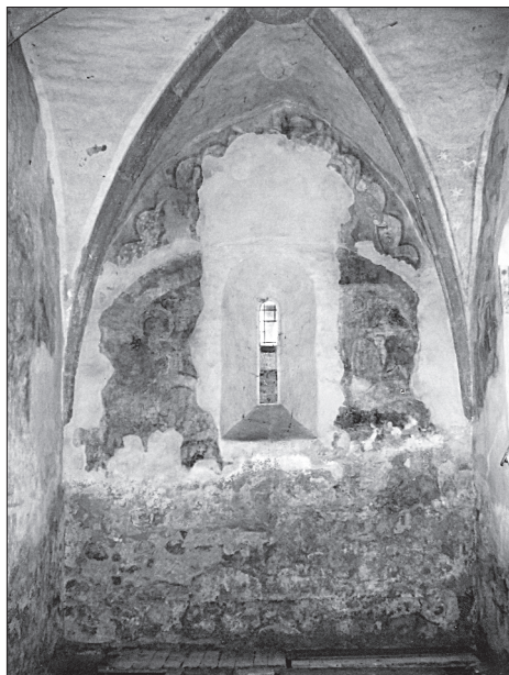
Obr. 2. Most pri Bratislave, Zvestovanie P. Márii a Ukrížovanie na východnej stene presbytéria.

Problémom bádania bol aj značne schátralý stav malieb, ako dokladajú fotografie