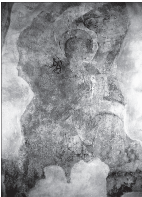
Obr. 3. Most pri Bratislave, Anjel zo Zvestovania P. Márii na východnej stene presbytéria.

Abb. 2. Most bei Bratislava, Verkündigung Mariä und Christus am Kreuz an der Ostwand des Chorraums.