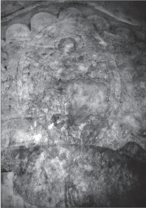
Obr. 10. Most pri Bratislave, apokalyptický Kristus v mandorle v obraze Posledného súdu na severnej stene, dolu oblúky a hlava Krista zo staršej vrstvy.