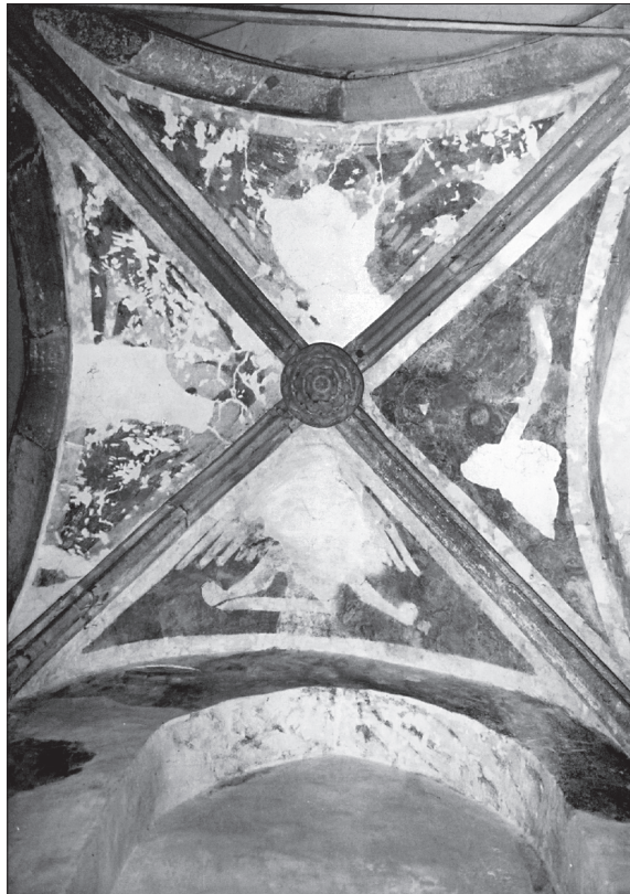
Obr. 11. Most pri Bratislave, klenba a fragmenty malby juhovýchodného oltárneho baldachýnu v lodi kostola.

s podstatnou charakteristikou hláv vo vykresľovaní mandľovitých očí, oblúkov obočia, plynulého spojenia s krivkou nosa a pravidelne zvlnených, pri tvári výrazne vykrúžených prameňov vlasov. Osobitným znakom sú tiež dôrazné gestá rúk s poukazujúcim pretiahnutým ukazovákom, z prírodných prvkov kryštálicky rozpukaná pôda a tvary stromov s naklonenými kmeňmi a pravidelnými kruhovými alebo oválnymi korunami s čiastočne zachovanou kresbou prísne usporiadaných listov. Málo sa zachovalo zo záhybového systému drapérií, ktorý sa dá ťažko presnejšie vymedziť, ale pozostatky vnútornej kresby naznačujú pomerne bohatú štruktúru najmä dolných prehybov a skladov látok i s voľnými výbehmi až malebne rozvinutých cípov. Viaceré spomenuté motívy a ďalšie detaily (napr. forma štítu stotníka, vyskytujúca sa vo viacerých zobrazeniach archanjela Michaela; Schaller 2006) sú sledovateľné v rámci všeobecných dobových a slohových