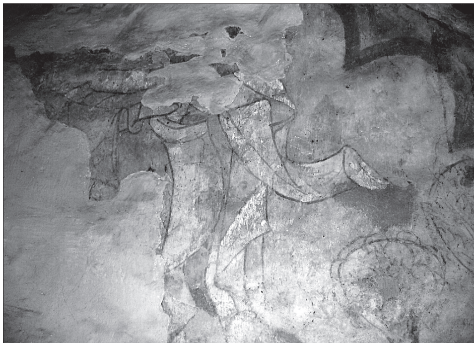
Obr. 6. Most pri Bratislave, fragment skupiny Krista s neveriacim Tomášom v hornom obraze južnej steny.

Horné pole pod lunetou klenby, rámované okrovými oblúčkami s červeným okrajom a červeno maľovanými cviklami, vyplňala scéna Ukrižovania, z ktorej sa zachovala v strede horná časť kríža, rúk a svätožiari Krista, na pravej strane fragment hlavy Jána evanjelistu a časť jeho rúcha, pri pravom okraji poľa takmer celá postava stotníka. Má na sebe tesný kabátec, siahajúci do polovice stehien, krátky plášťik, zopätý pri krku dvomi gombíkmi a turbanovitú pokrývku hlavy, v ľavej ruke drží rukoväť meča s guľovou hlavicou, ktorý je prekrytý prehnutým, dolu zašpicatým štítom s hákovým výbežkom, jeho zdvihnutá pravá ruka s natiahnutým ukazovákou smeruje ku Kristovi. Na ľavej strane poľa sa zachovala len časť jednej stojacej ženskej postavy, snáď Márie Magdalény, zahalenej do plášta, so svätožia-