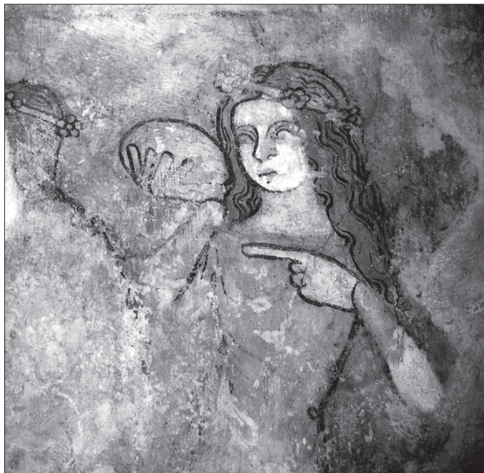
Obr. 9. Most pri Bratislave, detail postavy múdrej panny pri pravom okraji dolného obrazu južnej steny.

začiatok a koniec Kristovho pozemského života. Oba obrazy sú pritom obohatené motívmi, poukazujúcimi dôrazne na spojenie nebeského a pozemského diania. Vo Zvestovaní je okrem holubice Ducha sv., prilietavajúcej k Márii, prítomný Boh Otec (zachovaná jeho hlava v takmer v horizontálnej polohe) ako potvrdenie rozhodnutia vykúpiť ľudstvo z dedičného hriechu (LCI 4. 1990, 430), k čomu sa pridáva aj symbol stromu v zmysle života, plodnosti z božej vôle. V Ukrižovaní so zriedkavejším usporiadaním štyroch postáv pod krížom (z nich je úplne zničená figúra P. Márie) je vpravo vedľa Jána evanjelistu výrazná postava stotníka s nástojčivým gestom pravej ruky a natiahnutým ukazovákou ku Kristovej hlave, ktorým sa pripomínajú jeho slová „Naozaj, toto bol syn boží“ podľa Matúšovho evanjelia (27, 54).