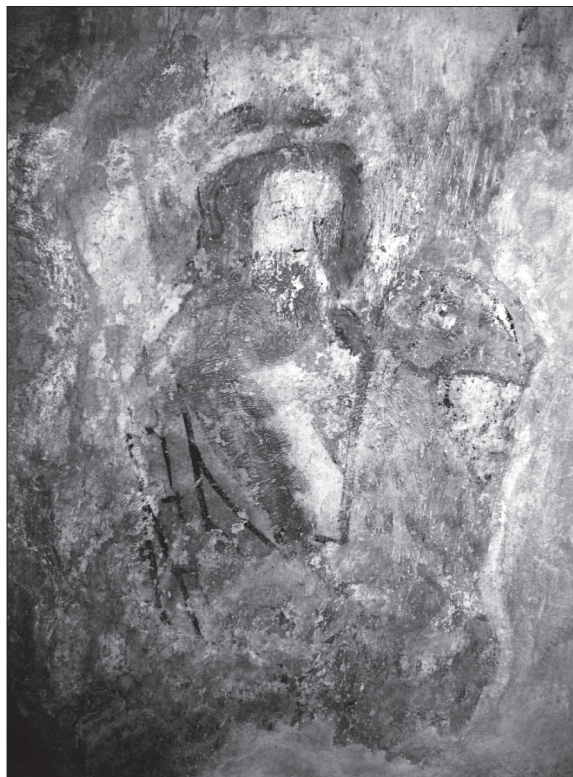
Obr. 7. Most pri Bratislave, fragmenty orla z prvej vrstvy a postavy z druhej vrstvy (Kristus?, Ecclesia?) v dolnom obraze južnej steny.