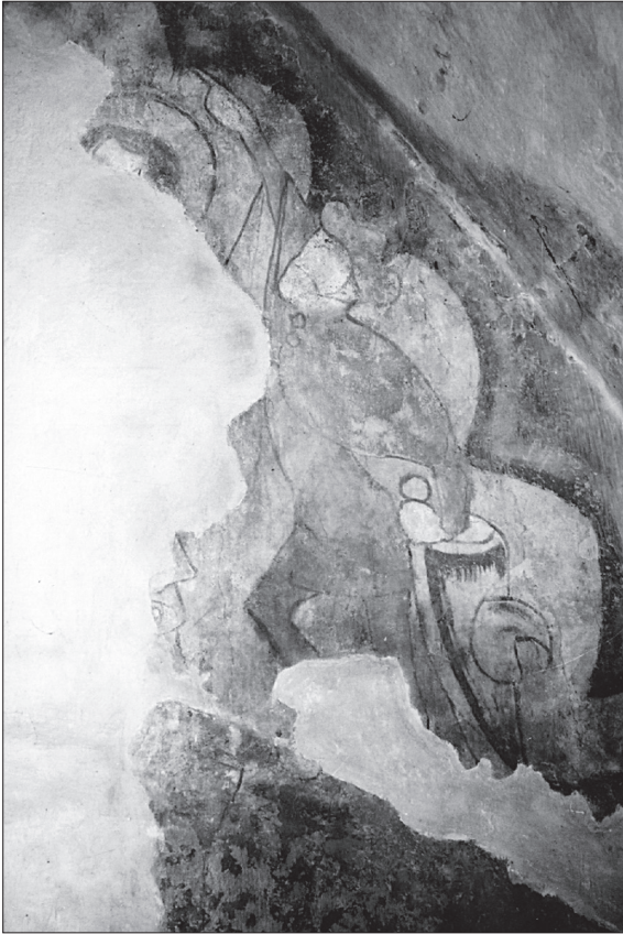
Obr. 5. Most pri Bratislave, fragment Jána evanjelistu a stotník v hornom obraze Ukrížovania na východnej stene.