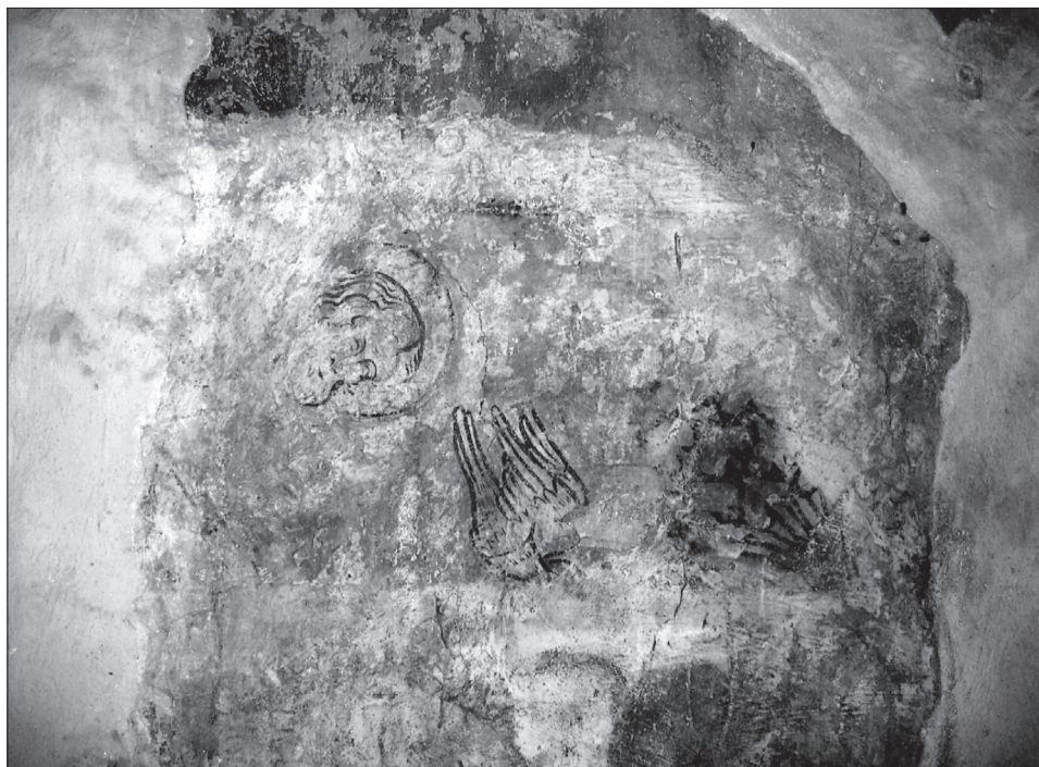
Obr. 4. Most pri Bratislave, hlava Boha Otca a holubica nad fragmentom hlavy P. Márie v obraze Zvestovania. Abb. 4. Most bei Bratislava, Kopf von Gottvater und Taube über dem Fragment des Kopfes der Jungfrau Maria im Verkündigungsbild.

Druhým dokladom je vyššie pripomenutá zvieracia figúra v ľavej časti južnej steny, v bezprostrednej blízkosti pôvodnej okennej špalety. Predstavuje najpravdepodobnejšie orla – zachoval sa z neho vzpriamený okrový trup s náznakom peria tmavočervenými oblúčkami, hlava s bielym okom a mierne zahnutým zobákom, časť chvosta s červenými linkami pier a nad hlavou čierno vykreslené konce pier rozťahnutého krídla. Opäť ani na tejto stene nie sú rozpoznateľné iné prvky (objavujú sa iba neurčité plochy okrovej a červenej farby okrem stôp lemujúcich pásov čela zaniknutej klenby), ktoré by mohli kontextuálne prispieť k interpretácii orla. Ponúka sa možnosť stotožniť ho so symbolom Jána evanjelistu, chýba však zásadne náplň väčšej časti obrazového poľa. Tam určite nemohli byť symboly ďalších evanjelistov. Orol má totiž úplne osamotené postavenie medzi oknom a okrajom poľa (zo štvorice evanjelistov by sa tak nelogicky vyčlenil), kde už nebol priestor pre ďalšie motívy, preto sa musel významovo vzťahovať k určitej scéne alebo postave, čo by napokon ako pendant zodpovedalo kompozícii na severnej stene. Je možné, že v rámci zdôraznenej väzby jednotlivých symbolov evanjelistov k určitým biblickým udalostiam a k ich najzávažnejším typom obrazov tu mohlo figurovať Zmŕtvychvstanie alebo Nanebovzatie Krista, ku ktorému sa v zmysle schopnosti vyletieť k nebeským výškam a podľa Physiologa omladnúť v slnečnej žiare