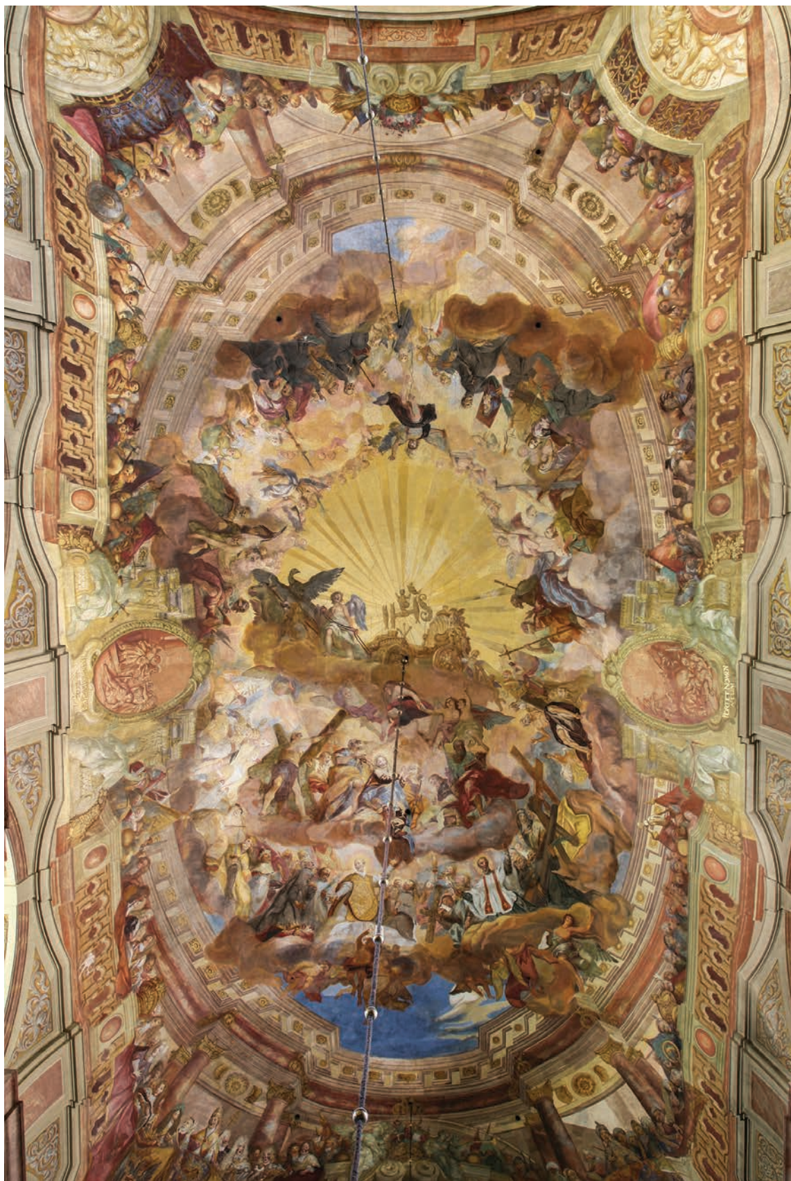
16 – Johann Michael Rottmayr, Triumf Ježíšova jména , nástropní malba, 1703–1706. Vratislav, kostel jména Ježíš