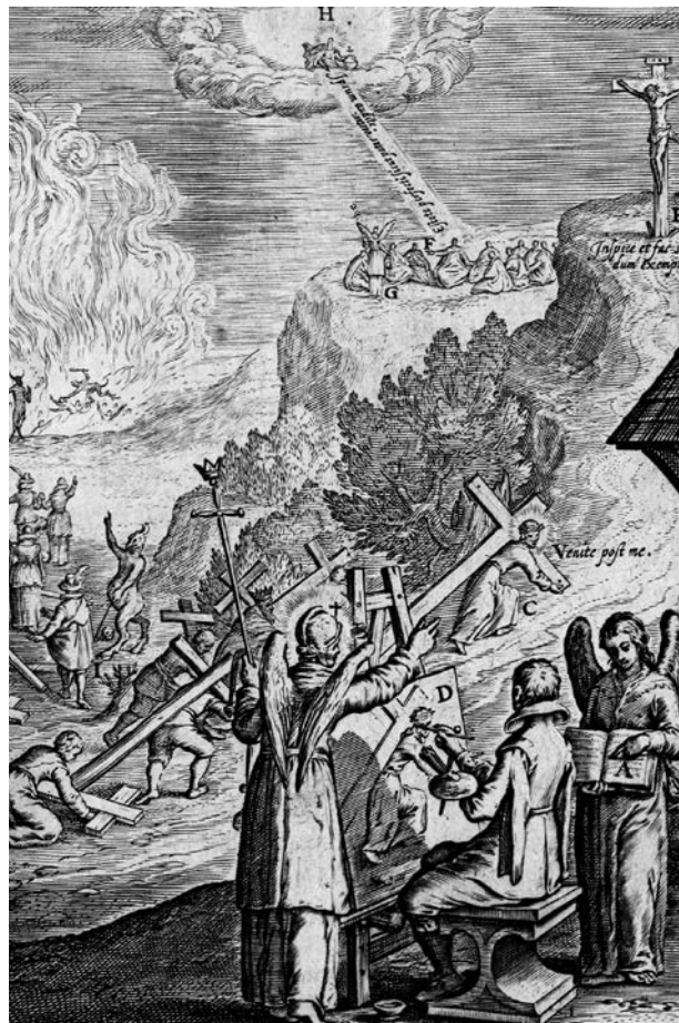
4 – Boetius à Bolswert, Následování Krista , mědiryt. Antonius Sucquet, SJ, Via vitae aeternae , Antverpia 1620

Princip napodobení i koncept odrazu Kristova života a jeho skutků v životě a činech sv. Ignáce či sv. Františka a propagace Ignácova a Františkova kultu byly stěžejní pro proselytické působení jezuitského řádu. Motiv napodobení Krista, ale také napodobení Ignácovy cesty byl reflektován zvláště v jezuitské emblematické produkci. V roce 1620 publikoval jezuita Antoine Sucquet (1574–1627) v Antverpách svou úspěšnou, bohatě ilustrovanou emblematickou sbírku Via vitae aeternae . [obr. 4] Sucquetova emblematická kniha a její ilustrace, které provedl Boetius à Bolswert (1585–1633) a které představují duši věřícího v podobě umělce, který následuje Kristova, případně Ignácova příkladu, ovlivnily další jezuitskou produkci. K ní patří i kniha Occupatio animae Jesu Christo Crucifixo devotae jezuitky Francisca Le Roy, která vyšla v Praze roku 1666. Frontispis navrhl Karel Škréta. 9 S momen-