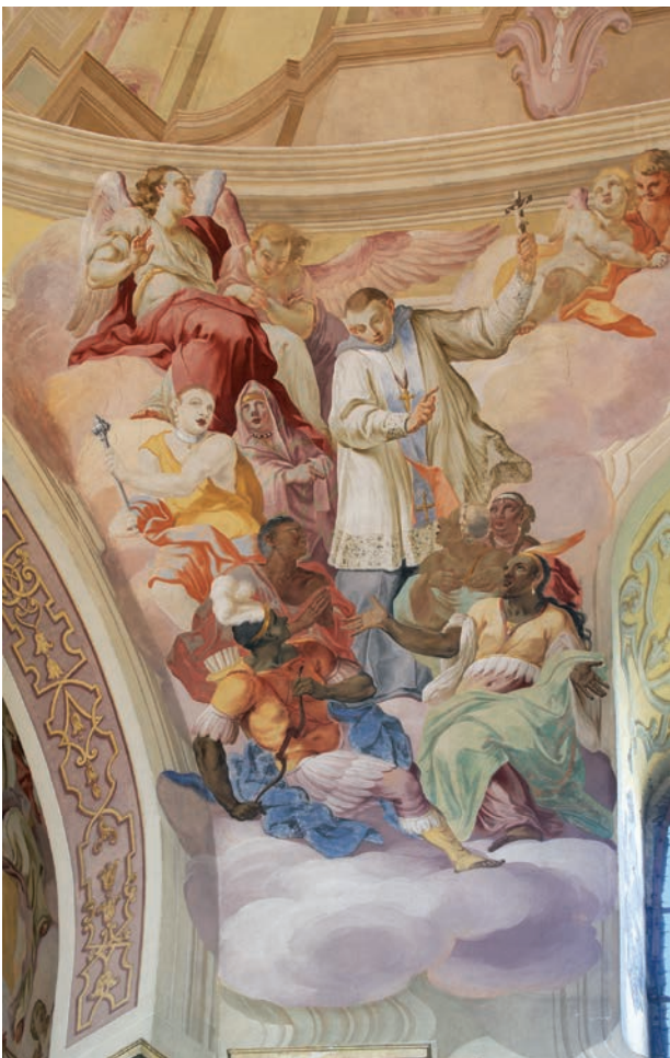
10 – Jan Jiří Etgens, Sv. Brendanus jako apoštol Afriky , nástropní malba, 1726–1727. Rajhrad, benediktinský klášterní kostel sv. Petra a Pavla

nárokovali své zásluhy při rekatolizaci protestantů ve Slezsku. Oproti jezuitům však benediktini svým projektem připomínali návazání na tradici starobylého benediktinského kláštera, který na uvedeném místě založila na počest svého zabitého syna v bitvě u Lehnice sv. Hedvika již ve 13. století.