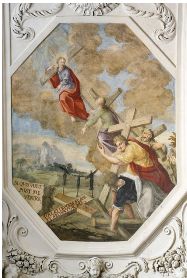
6 – Jan Ezechiel Vodňanský, Následování Krista , nástěnná malba, 1741. Praha-Nové Město, jezuitský kostel sv. Ignáce z Loyoly, kaple sv. Františka Xaverského

obrazení na titulním listu ukazuje umělce, který tvoří obraz podle vzoru sochy Ukřižovaného. Vyobrazeným tu však není nikdo jiný, než sv. Benedikt. Vztah tohoto motivu k ilustracím Sucquetovy knihy Via vitae aeternae je zřejmý. 16 [obr. 9]