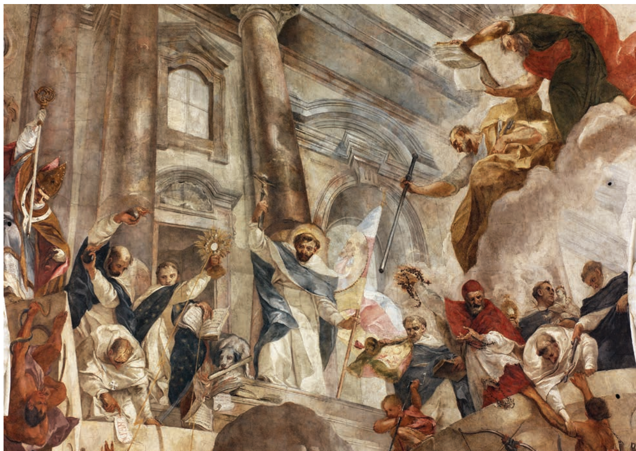
2 – Václav Vavřinec Reiner, Sv. Dominik a dominikánští světci brání katolickou církev (Sen papeže Inocence III.), nástropní malba, 1734. Praha-Staré Město, dominikánský kostel sv. Jiljí

Jak jsme již připomněli, specifickým způsobem využil obrazy k propagandě jezuitský řád. Jeden ze základů ignaciánské spirituality tvoří princip napodobení a následování Krista, Imitatio Christi . Sám Ignác četl vlivné knihy Tomáše Kempenského (kolem 1380–1471) a koncept imitatio je klíčový pro jeho Duchovní cvičení . Ignác sám byl pak v prostředí Tovaryšstva Ježíšova představován jako hlavní napodobitel Božího Syna a v kolegiu ostatních světců mu jezuité vyhrazovali eminentní postavení. Idea následování Krista sv. Ignácem byla rozvíjena již Ignácovými životopisci a jezuitskými teology. Ti zdůrazňovali důležitost napodobování Ježíše