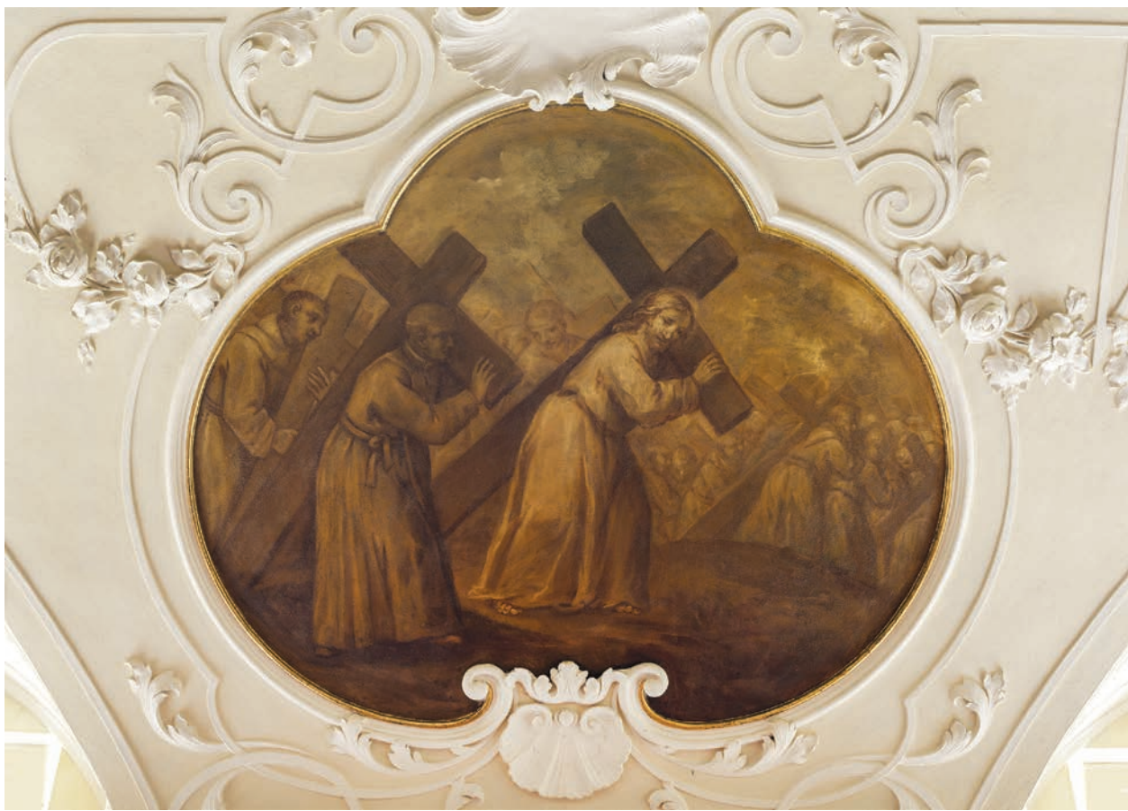
8 – František Lichtenreiter, Následování Krista , nástropní malba, 1745. Praha-Břevnov, benediktinský klášter, kapitulní síň

ornátech, liturgickém náčiní a v různých dalších situacích. Přes svou obecnou platnost a hlubší teologický význam byl tedy tento symbol jezuity v praxi užíván především jako identifikační znak řádu a jeho úspěšného projektu. S ohledem na jeho grafickou jednoduchost a výstižnost jej s jistou nadsázkou můžeme chápat jako firemní logo v moderním smyslu.