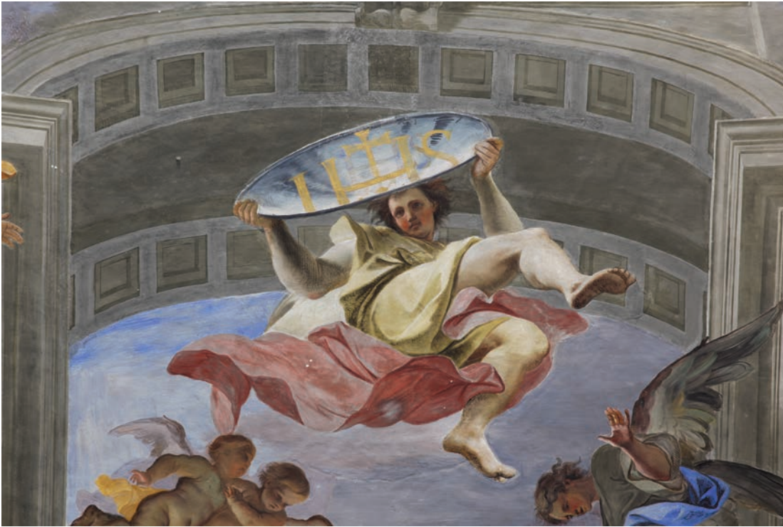
12 – Andrea Pozzo, Oslava misijní činnosti jezuitského řádu (detail s monogramem „IHS“), nástropní malba, 1691–1694. Řím, kostel S. Ignazio