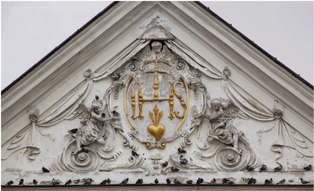
11 – Monogram „IHS“. Klatovy, kostel Neposkvrněného početí Panny Marie a sv. Ignáce z Loyoly, průčelí

Patronum adoptemus, certa spe pleni, quod sub ejus praesidio ac tutela nihil a maleficis, sit nobis metuendum. 27