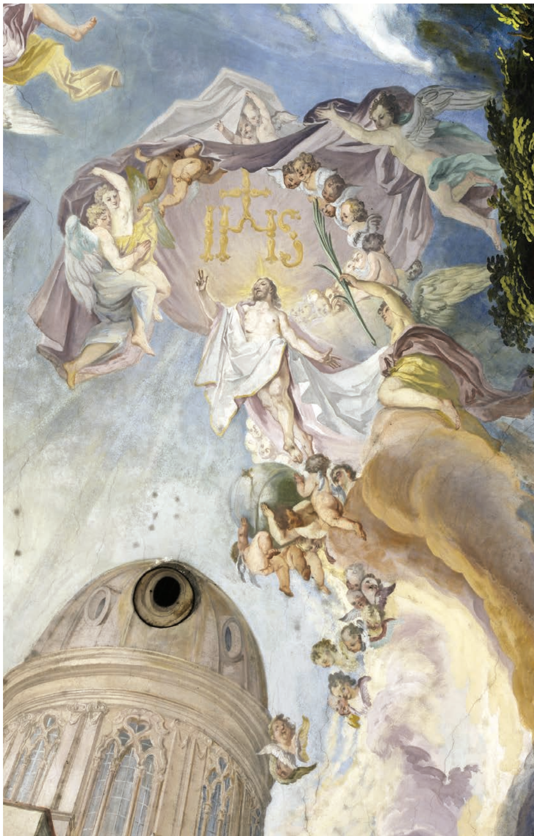
15 – Cosmas Damian Asam, Nalezení sv. Kříže (detail s motivem Vzkříšeného Krista a monogramem „IHS“), nástropní malba, 1733. Lehnické Pole, benediktinský klášterní kostel sv. Kříže a sv. Hedviky