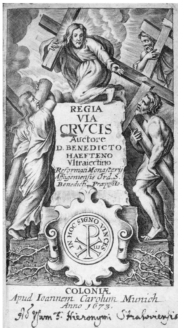
7 – Benedictus Haeften, OSB, Regia via crucis , Coloniae 1673, titulní list. Strahovská knihovna

V jezuitské spiritualitě i v jezuitském výtvarném umění je monogram „IHS“ někdy prezentován jako bezprostřední zrcadlení přítomného Boha a jako hlavní zdroj apoštolské aktivity Tovaryšstva Ježíšova. Exkvizitním příkladem tohoto pojetí je samozřejmě Pozzova malba v S. Ignazio. [obr. 12] Zároveň však monogram „IHS“, který sv. Ignác používal na svém pečeti, sloužil jako atraktivní znak, kterým se od poloviny 16. století značily jezuitské tisky a který se objevoval na fasádách a v interiérech jezuitských kostelů a domů, na uměleckých dílech,