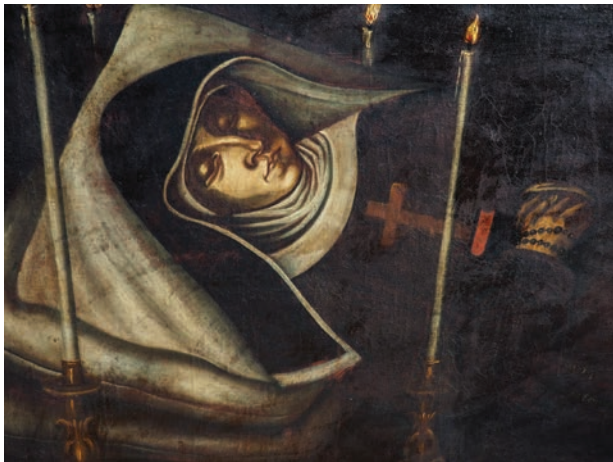
4 – Středoevropský malíř, Kateřina Frantiřka z Eitzingu (detail), 1666. Českomoravská provincie Římské unie řádu sv. Vorřily, depozitář Kanonie premonstrátů v Nové Říři