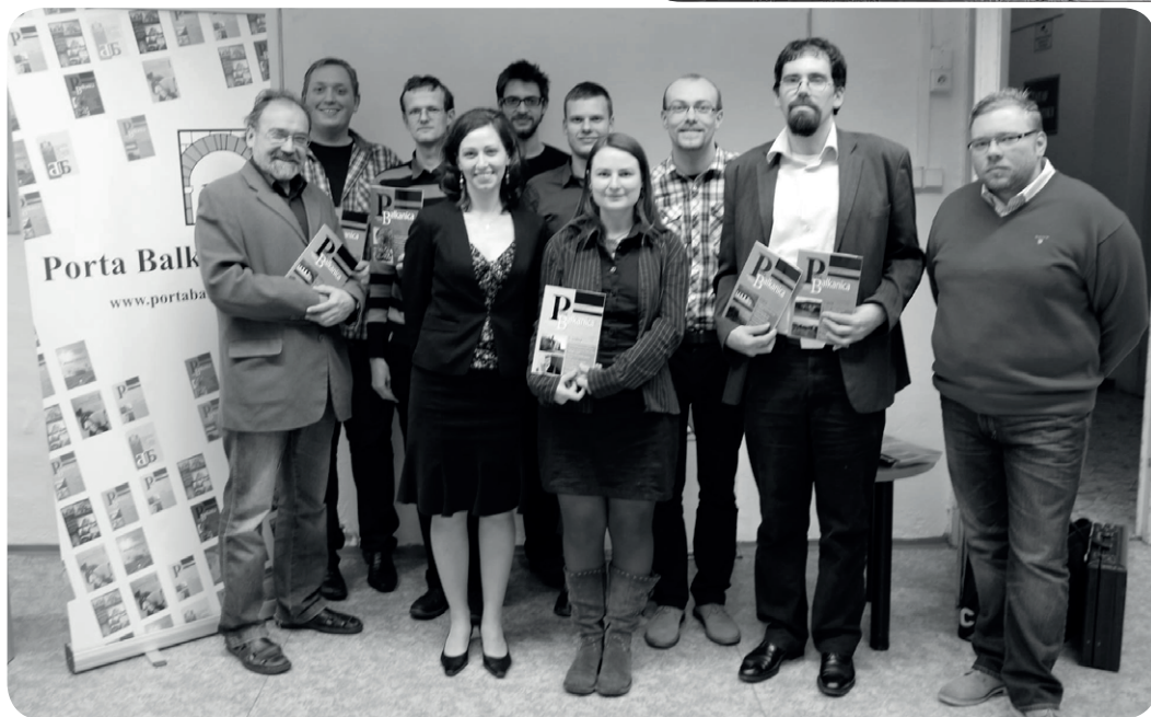
Výkonná rada časopisu Porta Balkanica