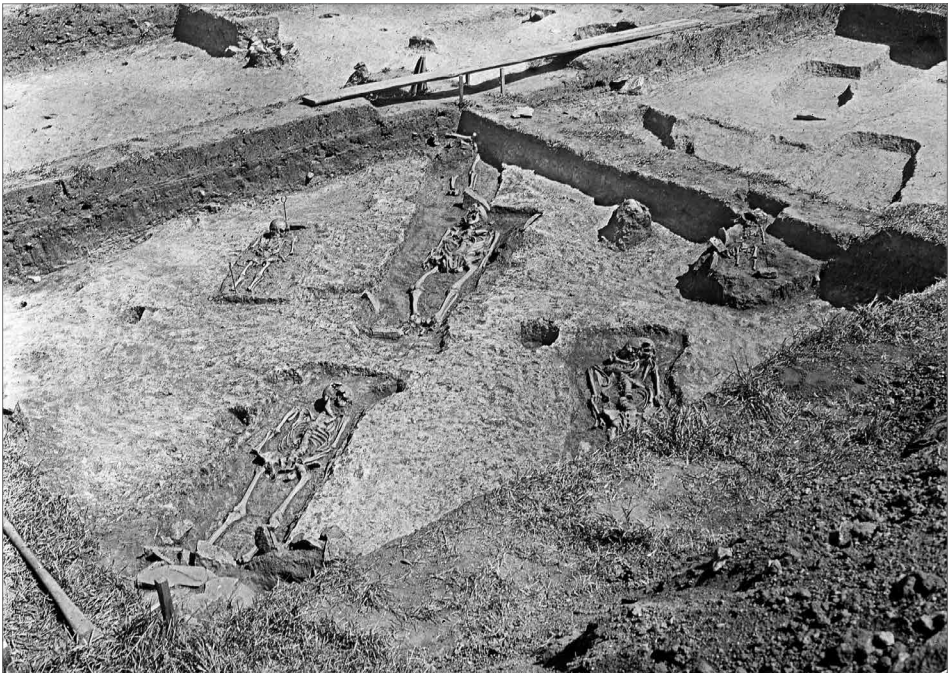
Obr. 5. Kostrové pohřebiště ve vnitřním areálu, sektor B1. Abb. 5. Skelettgräberfeld im Innern des Areals, Sektor B1.