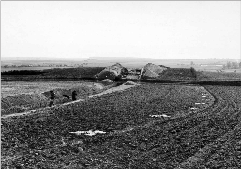
Obr. 2. Dlouhá sonda 1/1948 a řez destrukcí vnitřní hradby od severu.