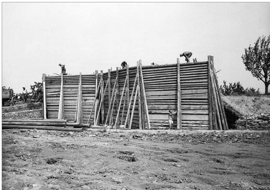
Obr. 4. Rekonstrukce vnější brány v roce 1952, západní křídlo. Abb. 4. Rekonstruktion des Außentors im Jahr 1952, Westflügel.