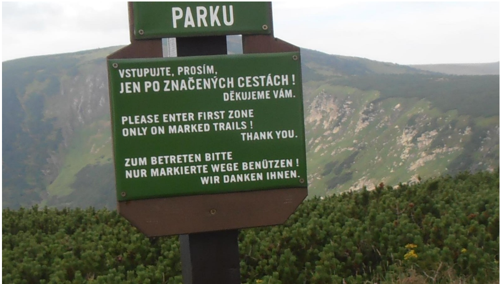
Илустрација № 5: Натпис испод планине «Снежка» (1603 м) у Националном парку «Крконоше» (Чешка)