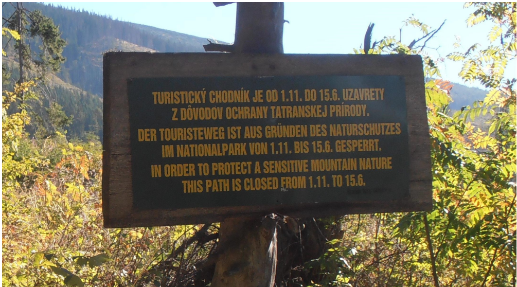
Илустрација № 6: Натпис на путу на врх «Кривањ» у Националном парку «Татра» (Словачка)