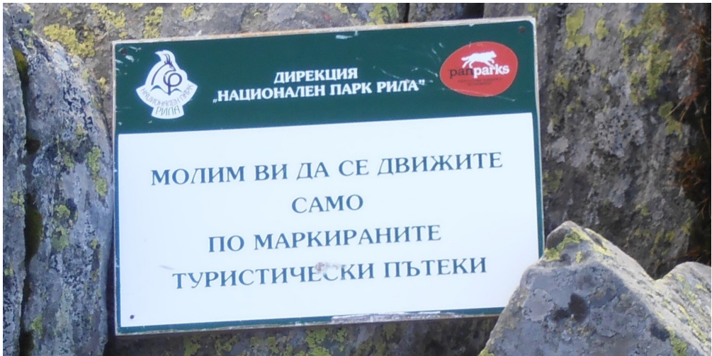
Илустрација № 8: Натпис у Националном парку «Рила» (Бугарска)