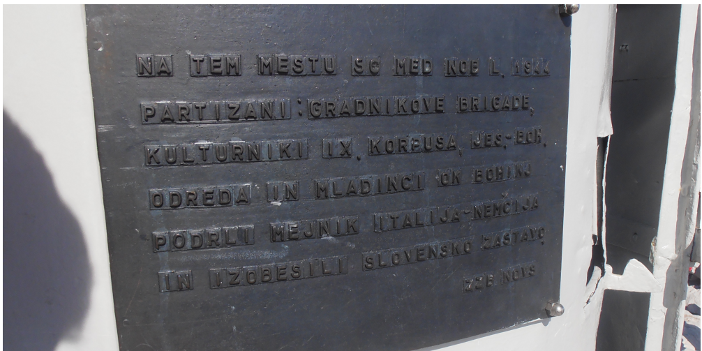
Илустрација № 4: Табла на Аљажевом столпу на врху планине «Триглав» (2864 м) у Националном парку «Триглав» (Словенија)