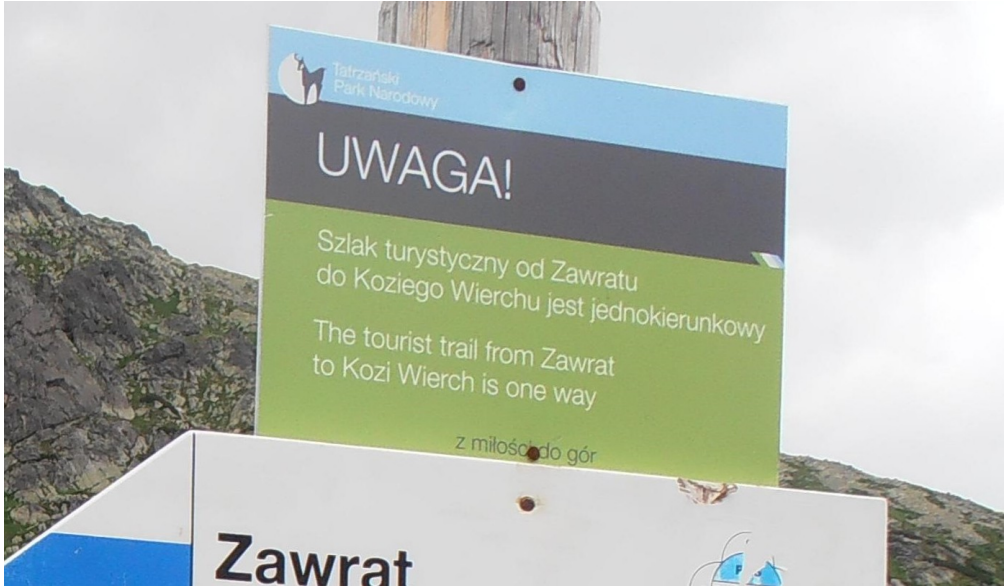
Илустрација № 7: Натпис у Националном парку «Татра» (Пољска)