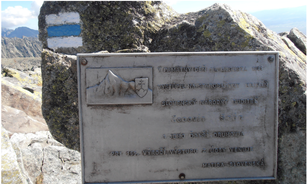
Илустрација № 3: Табла на врху планине «Кривањ» (2494 м) у Националном парку «Татра» (Словачка)