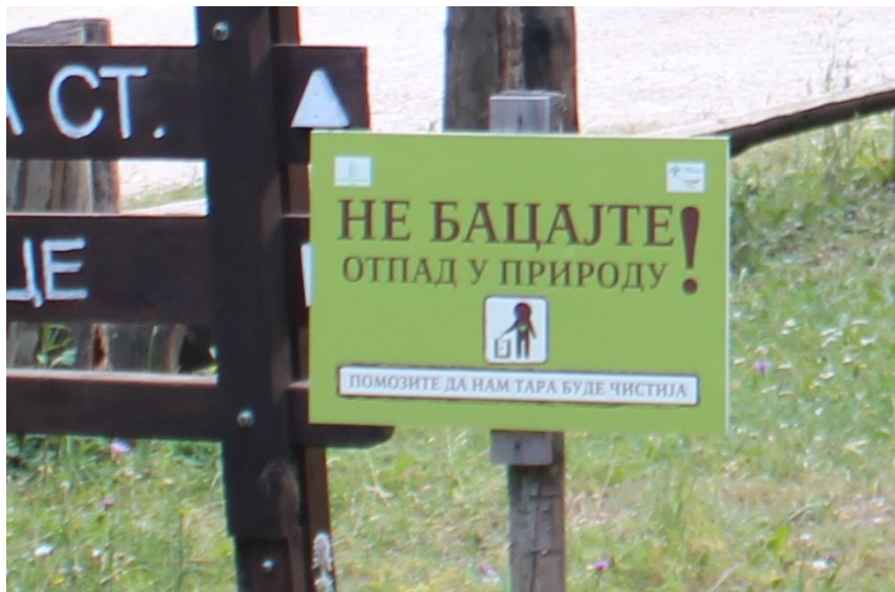
Илустрација № 2: Званични натпис у Националном парку «Тара» (Србија)