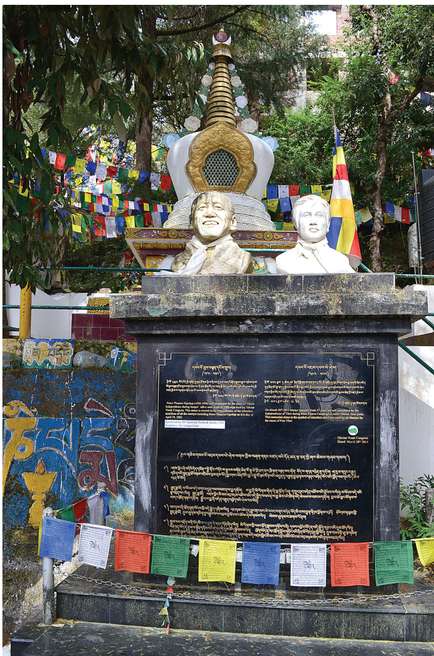
Obr. 1: Busty sebeupálených mučedníků z okolí komplexu Cuglakhang.