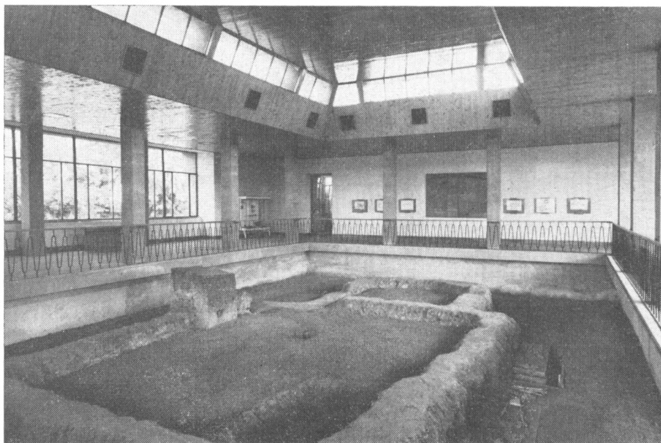
Obr. 1. I. Typ krycí stavby nad významnou archeologickou památkou. Staré Město u Uherského Hradiště – lokalita Na Valách. Nad nálezem dr. V. Hrubého z května r. 1949 jako nad první zjištěnou architekturou z doby Velkomoravské říše byla na sklonku padesátých let vybudována podle projektu akad. arch. V. Hradíla a ing. arch. M. Suchánka stabilní krycí stavba jako důstojný Památník Velkomoravské říše.