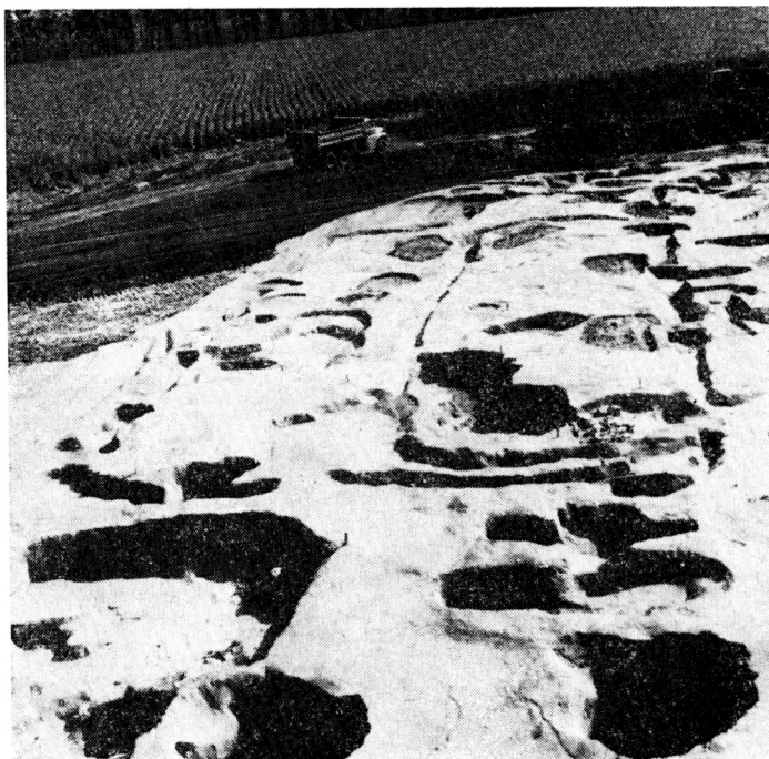
Obr. 2. Bajč, poloha Medzi kanálmi (okr. Komárno). Pohľad na odkrytý pôdorys žlabov — obdĺžnikovej, pôvodne nadzemnej stavby ľahkej konštrukcie.

stranách Žitavy nielen v polohe Medzi kanálmi (Vlhké lúky), ako aj v polohách Góre a Ragoňa, kde sa už v predchádzajúcich rokoch uskutočnili záchranné výskumy pravekého a včasnohistorického osídlenia, pre ktoré práve naviate pieskové duny poskytovali ideálne miesta k osídleniu v povodí rieky Žitava, ktorá sústavnne meandrovala a tak menila svoje koryto. Na jednom z pieskových násypov (duny) sa zistili doklady intenzívneho pravekého osídlenia (z mladej doby kamennej: železovská skupina, a z neskorej doby kamennej: skupina Kosihy-Čaka), ojedinelé dôkazy osídlenia z doby laténskej, včasnostredovekého osídlenia z veľkomoravského (9. storočie) a veľkomoravského (10. storočia) obdobia, ako aj z počiatkov vrcholného stredoveku (11.—12. storočia). V tomto roku sa preskúmala plocha okolo 2 000 m 2 , t. j. asi štvrtina celkove ohrozenej osídlenej polohy. Keďže je potrebné uvoľniť celú osídlenú plochu v rámci zámerov rozsiahlej rekultivácie, vo výskume sa bude pokračovať aj v budúcom roku a tak iste bude možné vytvoriť si oveľa plastickejší a presnejší, vernejší obraz o sídelnom vývoji v priebehu 9.—12. storočia na tejto lokalite, a to už v porovnaní s výsledkami prieskumu celého mikroregiónu. Preto predložené výsledky je potrebné chápať informatívne a majú vyslovene pracovný charakter.