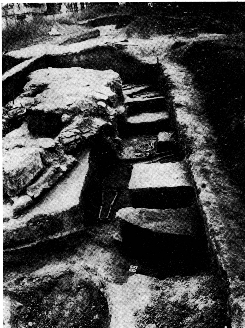
Obr. 1. Kežmarok — kostol sv. Máchala (okr. Poprad). Pohľad na výskum západného uzáveru sakrálnej stavby a cintorína.

V tomto roku sa začal realizovať aj druhý oveľa rozsiahlejší záchranný archeologický výskum v katastri obce Bajč, okr. Nové Zámky, v polohe Medzi kanálmi (Čaplovič—Cheben—Ruttkey 1988, v tlači), ktorý bol vyvolaný rozsiahlymi rekultivačnými prácami a planirovaním pieskových dún po oboch