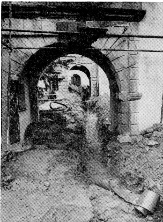
Obr. 1. Hrad Sovinec, výkop pro přípojku inženýrských sítí provedený bez archeologického dohledu.

za první branou a zejména při pořizování zcela nevhodných cementových omítek. U poměrně dlouhého výkopu pro inženýrské sítě stavebník vůbec nezajistil záchranný výzkum, archeologický výzkum byl zahájen až v prostoru mezi velkou věží a obvodní hradbou vnitřního hradu (Kohoutek 1993). Hrad byl převeden ze správy okresního muzea na samostatnou organizaci Hrad Sovinec, avšak ta se fakticky nikdy neustavila a práce na hradě organizoval většinou přímo referát kultury okresního úřadu, nebo sám správce hradu.