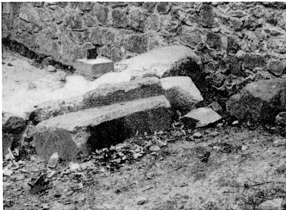
Obr. 2. Hrad Choustník, architektonické články v předhradí. V pozadí je dobře patrné pokrytí koruny zdiva cementovou směsí. Foto J. Noll, 1993.

Odlišný charakter měla obnova a osudy jihočeského hradu Choustníka u Tábora. Hrad prodělal v 80. letech rozsáhlou obnovu, kterou projekčně i dodavatelsky zabezpečoval Jihočeský podnik pro údržbu památek Tábor, tedy organizace, která by měla být mimo vši pochybnost považována za povolanou k tomuto úkolu. K obnově bylo provedeno zaměření, v němž lze na první pohled najít chyby, vyplývající z jeho jen velmi průměrného řemeslného pro-