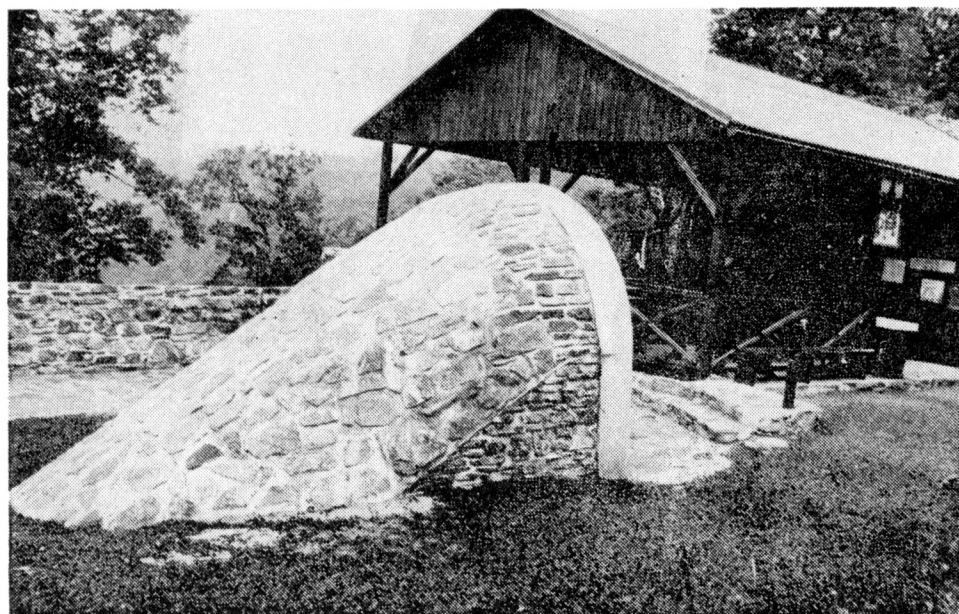
Obr. 3, 4. Hrad Hasištejn, vstup do sklepa na předhradí „obnovený“ podle projektu ing. arch. M. Hnáta. Foto J. Noll, 1993.