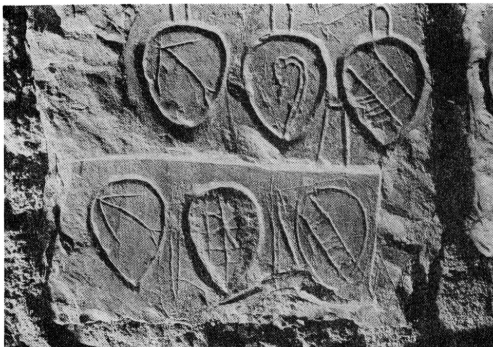
Obr. 3 Detail erbů na rytině č. 39. Stav po odkrytí v r. 1959.