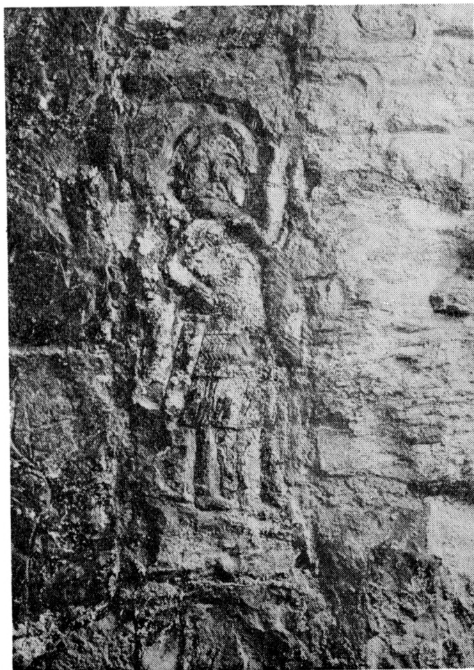
Obr. 5. Ozbrojenec na rytině č. 16. Stav v r. 1983.

Pokládáme-li za původce rytin vítěznou stranu konfliktu, čemuž nasvědčuje znak Hrabišiců jako erb nejvěrnějšího příslušníka Václavovy družiny Boreše z Rýzmburka, nabízí se otázka ztotožnění dalších šlechtických bojovníků královského vojska. Jména dvou hlavních straníků Václavových známe z Dalimilovy kroniky (FRB III, 180), kde je vedle zmíněného Boreše uváděn