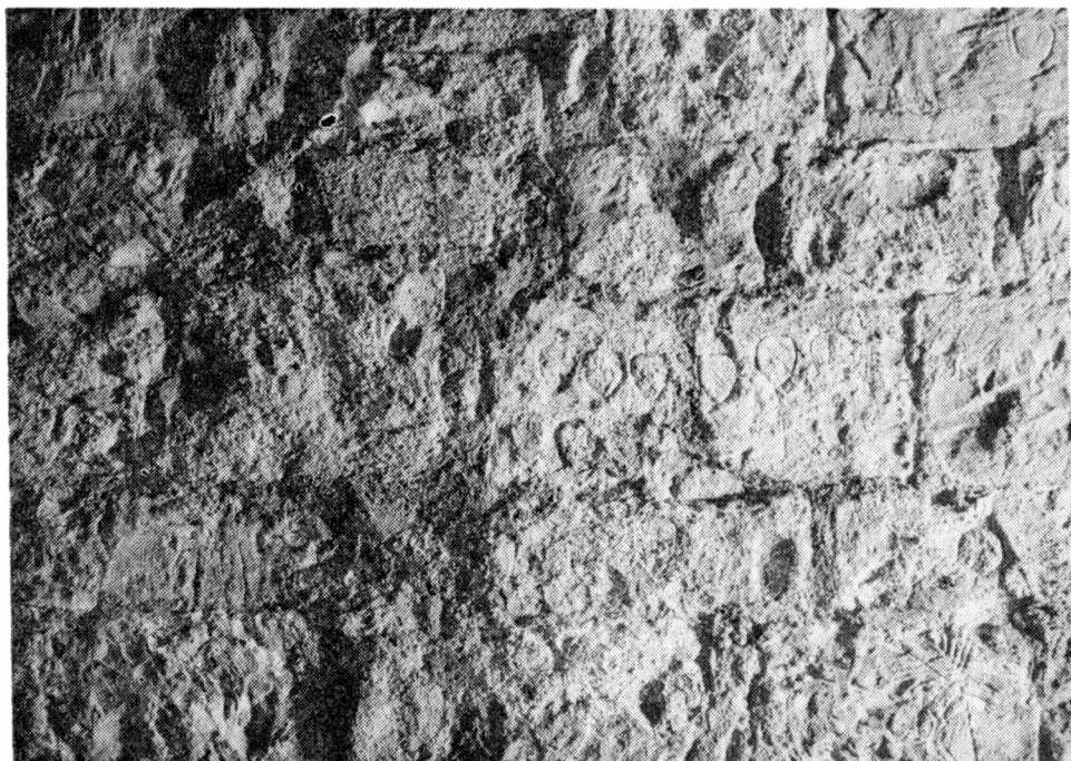
Obr. 2a a 2b. Srovnání stavu rytin po odkrytí a v roce 1992. Uprostřed záběrů rytiny s erby č. 38 a 39, vpravo nahoře zkřížené hrábě na rytině č. 46, vpravo dole jelen na rytině č. 21.