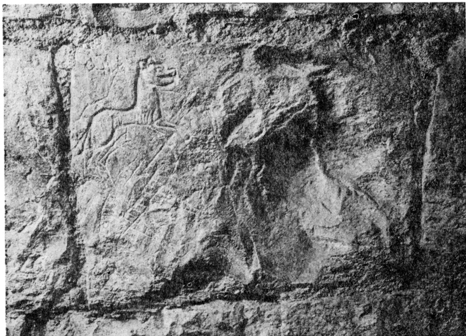
Obr. 7. Běžící pes na západní stěně Interiéru. Stav v r. 1983.