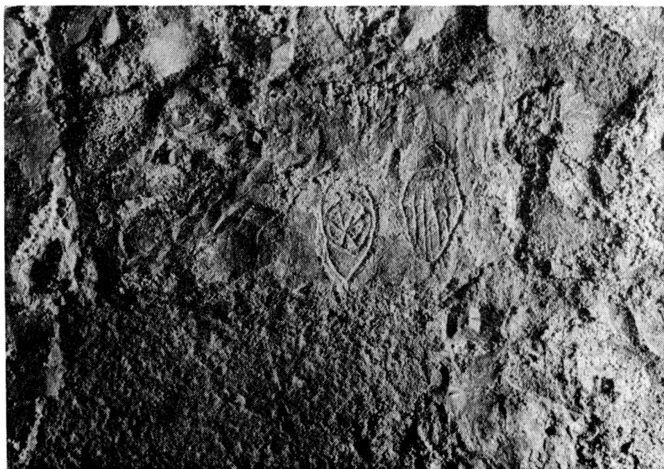
Obr. 4. Erby se stylizovanými přilbami na rytině č. 41. Stav v r. 1992.