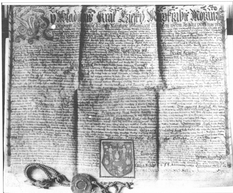
Obr. 2. Artikule tovaryšského „pořádku“ horažďovického hrnčířského cechu z r. 1585.

Naopak od druhé poloviny 17. století a z 18. věku je k dispozici řada písemných pramenů, obsahujících mnoho zajímavých a často unikátních pramenů, které nebyly z jiných cechů dosud známy a publikovány. V této souvislosti lze jen dodat, že dosud neúplnějším přehled o dobách založení, případně potvrzení existence různých hrnčířských cechů, o jejich cechovních znameních a výrobních nástrojích podal již dříve L. Skružný (1974). Mezi více než 180 v jeho studii uváděných mistrovských a tovaryšských hrnčířských cechovních organizací z nejrůznějších míst Čech, Moravy a Slovenska, datovaných do širokého časového rozmezí mezi počátek 15. a první polovinu 19. století, zde však chybí jakákoliv zmínka o hrnčířích a jejich cechu z Horažďovic. Proto je třeba informace, které zde uvádíme, považovat za zcela nové a dosud neznámé.