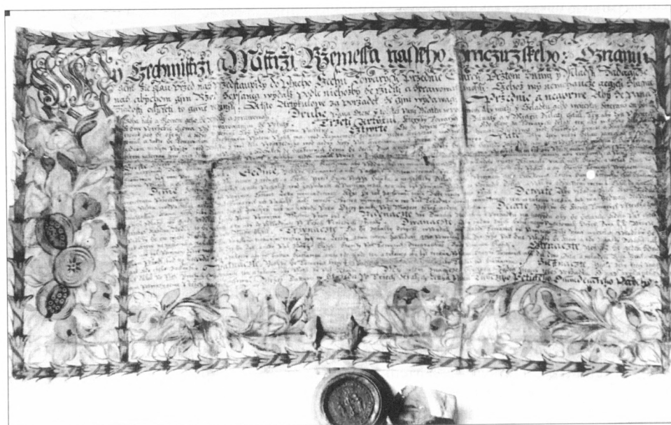
Obr. 1. Artikule tzv. „Zemského hrnčírského cechu“, udělené králem Vladislavem Jagelonským hrnčírům Nového Města pražského r. 1488.

Cechovní organizace hrnčírů zde však vznikla až někdy v průběhu 15. století. Nejstarším písemným dokladem jsou z tohoto hlediska artikule hrnčírského cechu, uložené v Okresním archivu v Klatovech. Jsou sice datovány nejpravděpodobněji k r. 1488, ale zřejmě se nejedná o originální artikule přímo horažďovického cechu, ale spíše o vidimus artikulí, udělených králem Vladislavem Jagelonským ve stejném roce hrnčírům Nového Města pražského (obr. 1). Jako i v jiných podobných případech obdobná cechovní statuta pražských řemeslníků se mohla se souhlasem panovníka stát tzv. „zemským cechem“. Jejich konkrétní ustanovení měly pak právo převzít do svých místních artikulí i venkovské cechovní organizace a tak přizpůsobit svoji práci odpovídajícímu pražskému cechu. Svědčí o tom mj. i šestnáctý článek zmíněného ustanovení novoměstského cechu, kde se sděluje, že „... všichni mistři i starší ze všeho království Českého řemesla hrnčírského kdyby chtěli k cechu Nového Města pražského slušeti, že mají býti jakožto přátelé milí přijmuti a zachováni při všech artikulích“ (Janotka–Linhart 1987). Zmíněné artikule patří k nejkrásnějším, stejně jako o něco pozdější artikule tovaryšů horažďovického hrnčírského cechu z r. 1585 (obr. 2).