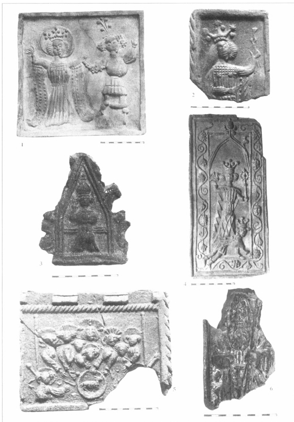
Tabulka I. 1 – Sv. Alžběta Durynská, Třeš (okr. Jihlava) – bývalá dívčí škola, 2. pol. 15. stol.; 2 – Sv. Apolonie, Heraltice (okr. Třebíč) – blíže neurčeno, 2. pol. 15. stol.; 3 – Církevní otec – sv. Augustin (?), Ivančice (okr. Brno-venkov) – Drúbežní trh, kolem pol. 15. stol.; 4 – Christologický motiv, Velké Meziříčí (okr. Zďár n. S.) – při úpravě domu Horní město 423, 2. pol. 15. stol.; 5 – Poslední večeře Páně, Radošov – Horní Smrčné (okr. Třebíč) – blíže neurčeno, 2. pol. 15. stol.; 6 – Sv. Jakub Větší, Prostějov (okr. Prostějov) – dům U Zlaté studny (nám. T. G. Masaryka), 1. pol. 16. stol.